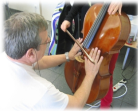
Photo 1 : écoute acoustique

Ici, nous passons à une écoute acoustique de la musique, c'est à dire sans amplificateurs. Les