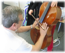
Photo 1 : écoute acoustique

Ici, nous passons à une écoute acoustique de la musique, c'est à dire sans amplificateurs. Les