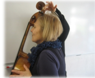
Photo 2 : sens vibratoire