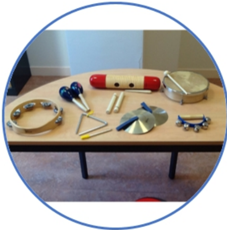
Image 1 : Instrumentarium mis à disposition des participants.