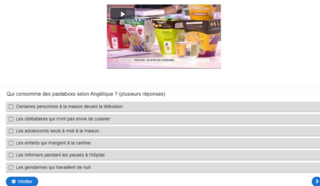
Figure 4. Exemple d'un exercice de QCM

L'utilisateur répond à une question proposant une ou plusieurs bonnes réponses. Le concepteur définit si une ou plusieurs réponses sont attendues, ce qui est identifiable par l'emploi des boutons radios ou des cases à cocher.