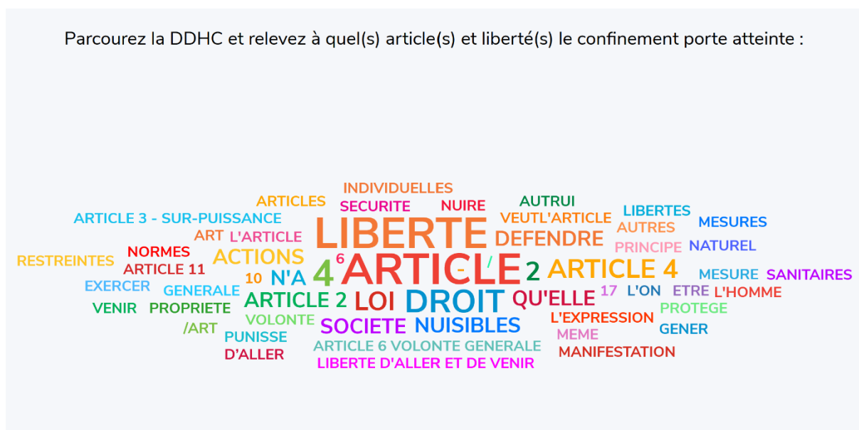
Figure 5. Capture d'écran du résultat des votes générés par un sondage Wooclap pendant le cours de droit constitutionnel portant sur les atteintes à la DDHC de 1789 par le confinement.

Ces modalités d'enseignement ont aussi permis d'aller plus loin sur certains points, en lien avec l'actualité. Par exemple, les étudiants ont eu à déterminer à quels principes de la Déclaration des droits de l'Homme et du citoyen de 1789 le confinement porte-t-il atteinte (Figure 5).