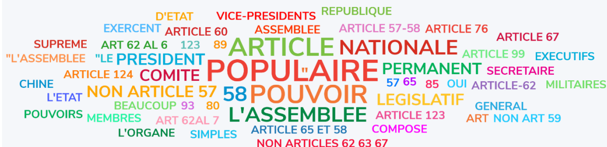
Figure 3. Capture d'écran du résultat des votes générés par un sondage Wooclap pendant le cours de droit constitutionnel.

La Constitution chinoise met-elle en place une séparation des pouvoirs ? (citez les articles)