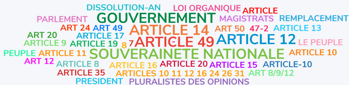
Figure 2. Capture d'écran du résultat des votes générés par un sondage Wooclap en nuage de mots, pendant le cours de droit constitutionnel.

En vous basant sur la Constitution de 1958, citez des mécanismes d'interdépendance organique: