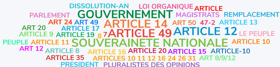
Figure 2. Capture d'écran du résultat des votes générés par un sondage Wooclap en nuage de mots, pendant le cours de droit constitutionnel.

En vous basant sur la Constitution de 1958, citez des mécanismes d'interdépendance organique: