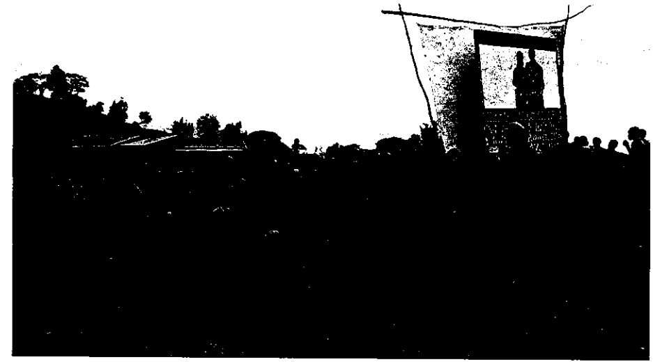
Projection au village de Dokatto.

En voulant montrer ce film à ses acteurs, nous nous inscrivions dans un double mouvement. Nous souscrivions aux réflexions déontologiques de la discipline, qui soulignent l'importance de la restitution de l'enquête aux enquêtés comme un juste retour du temps qu'ils ont consacré aux chercheurs, et comme possibilité qui leur est offerte de savoir ce qui est dit d'eux. Nous prenions par ailleurs cette restitution comme un prolongement de la recherche, dans la mesure où elle permettait de tester la validité de nos choix et plus généralement, créait les conditions d'un dialogue interculturel susceptible de nous en apprendre plus encore sur nos acteurs, le sens qu'ils donnent à leurs actions et à notre interaction. Nous prenions par là le film autant comme un document en soi que comme outil de recherche.