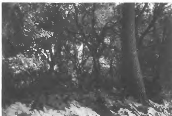
Pino-Quercetum ilicis. Parc de la Maison forestière de Montchic (Gironde).