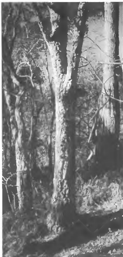
Pin bouteille. Forêt usagère de Biscarrosse (Landes).

L'origine de ces forêts usagères remonte au Moyen Age (XIII e siècle) où les seigneurs ont reconnu par charte le droit d'usage aux habitants. En effet, dans une forêt usagère, il y a d'une part des propriétaires qui ont aussi droit au gemmage et d'autre part des usagers ayant droit au bois. Un syndic assure le contrôle et délivre les droits de coupe.