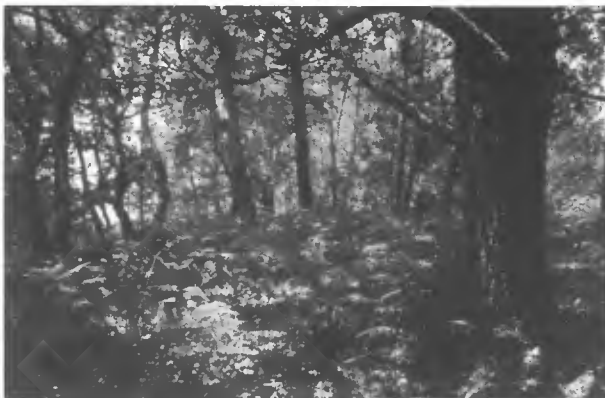
Lambeau de vieille dune à Contis (Landes).