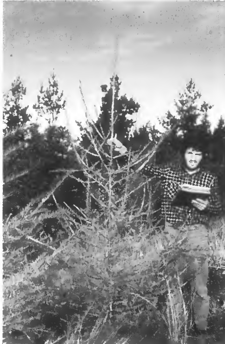
Larix eurolepis - 4 ans (pente)

Il est bien sûr trop tôt pour porter un jugement sur une utilisation éventuelle du Mélèze hybride comme essence de reboisement en Haute Margeride. Ses performances très encourageantes à 4 ans méritent d'être confirmées et son comportement en site plus exposé devrait aussi être étudié.