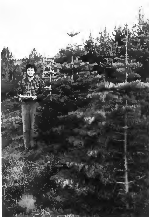
Abies concolor - 11 ans (pente)

On notera avec intérêt que la survie en crête reste comparable à celle enregistrée dans les deux autres sites moins exposés. La vigueur varie du simple au double selon les provenances et confirme le bon comportement des origines californiennes (Fowells, 1965) qui, pour ce caractère, atteignent presque le niveau des meilleures provenances d' Abies balsamea .