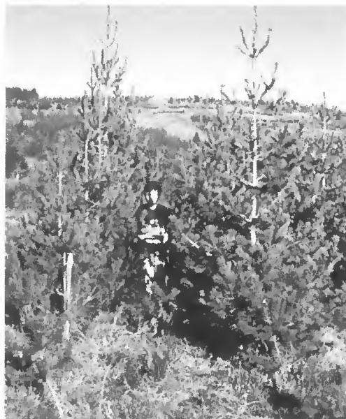
Pinus monticola - 10 ans (col)