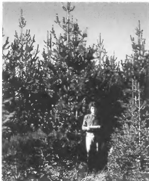
Pinus contorta - 11 ans (col)