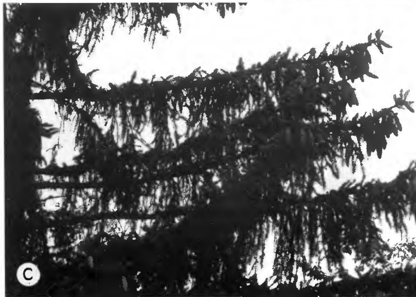
Figure 1 ÉPICÉA DÉPÉRISSANT, DÉTAIL :

A : DÉFOLIATION IMPORTANTE, AXES DES RAMEAUX APPARENTS, PRÉSENCE DE LICHENS. B : EXAGÉRATION DU PORT PENDANT DES RAMEAUX SECONDAIRES, « LAMETTA SYMPTOM ». C : FRUCTIFICATION ABONDANTE.