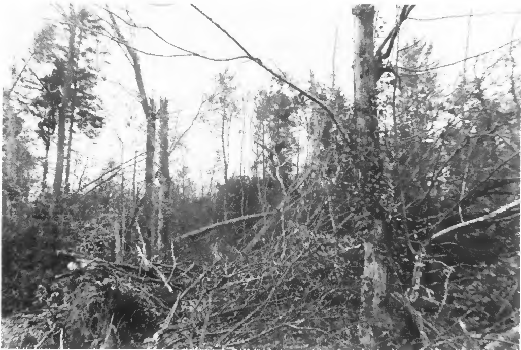
Coat Liou (Côtes-du-Nord). Vieille futaie mélangée : feuillus et résineux.