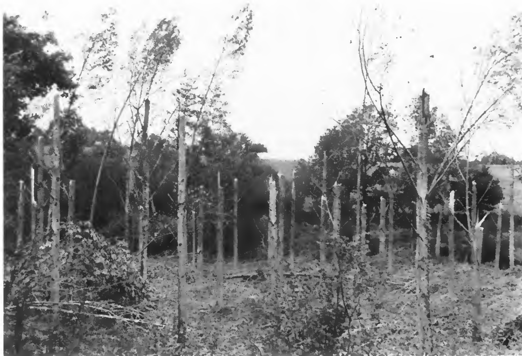
Peupleraies (Robusta), près de Broons (Côtes-du-Nord).