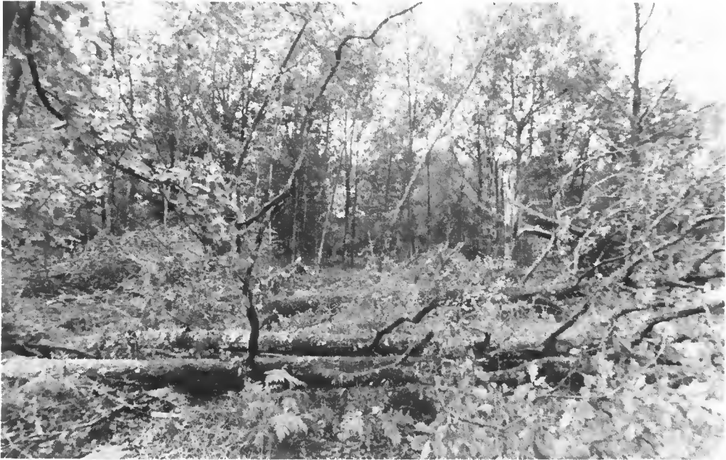
Forêt de La Hardouinai (Côtes-du-Nord). Dégâts diffus dans un ancien taillis-sous-futaie.