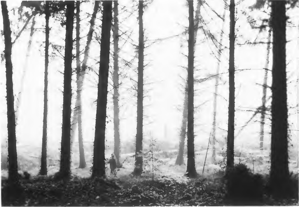
Bois de Keriu (Gouezec, Finistère). En bordure d'un couloir suivi par le vent. Plantation d'Épicéa de Sitka d'une trentaine d'années.