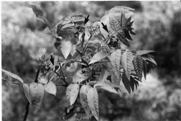
Fleurs femelles de Noyer noir

D'autres formules hybrides présentent un intérêt potentiel pour le forestier : les hybrides Juglans major (originaires du Sud-Ouest des Etats-Unis) × Juglans regia et les hybrides Juglans hindsii (origine californienne) × Juglans regia . Ces derniers, utilisés comme porte-greffe en arboriculture fruitière et connus sous le nom de Paradox, seraient susceptibles d'être employés en particulier en région méditerranéenne.