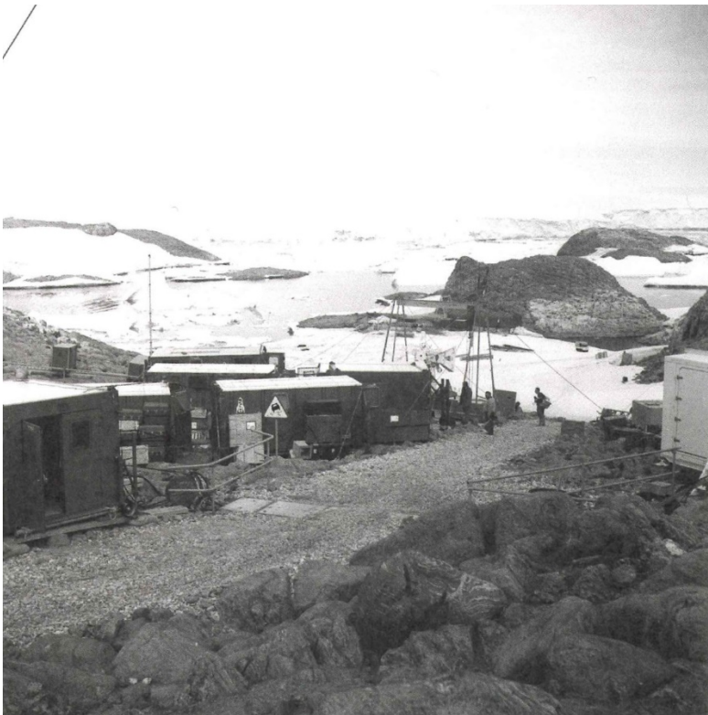
p.164 : Le site de lancement vu depuis la zone des équipements de contrôle et de suivi des fusées, été 1967.