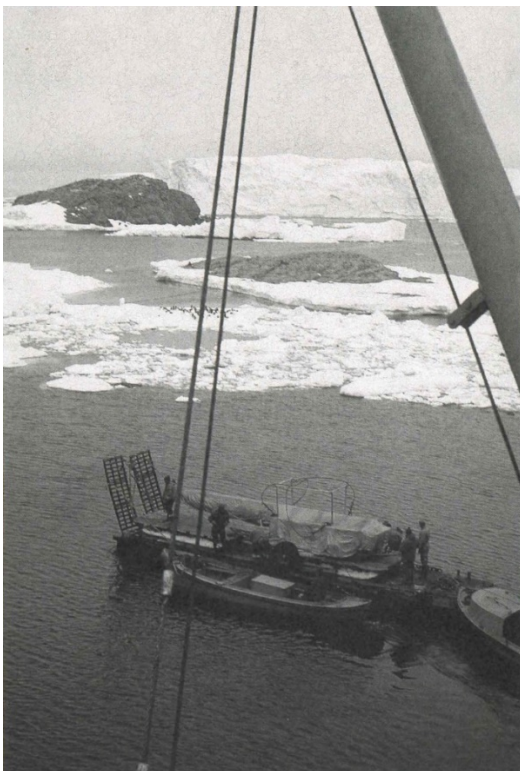
p.154 : Débarquement de l'une des fusées-sondes Dragon, été 1967 (IPEV).