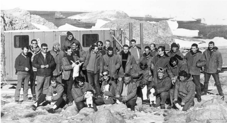
p.160-161 : L'équipe des ingénieurs du CNES et des scientifiques du GRI lors des campagnes d'été 1967.

Sebastian V. Grevsmühl, « Le lancement de l'âge spatial en Antarctique. Une perspective visuelle », Strate(s), Photo+Graphies de l'aventure spatiale , no. 1, 2021, p.182-189.