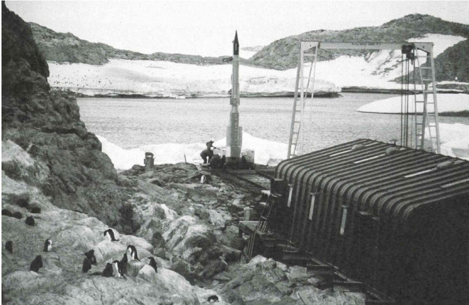
p.157 : La fusée-sonde Dragon dressée sur sa rampe de lancement au bout du chemin de fer, été 1967.

Sebastian V. Grevsmühl, « Le lancement de l'âge spatial en Antarctique. Une perspective visuelle », Strate(s), Photo+Graphies de l'aventure spatiale , no. 1, 2021, p.182-189.