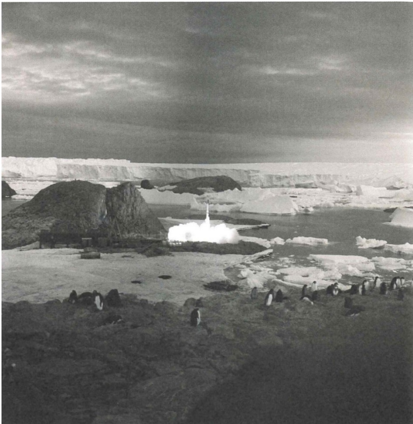
p.158 : Lancement d'une fusée-sonde Dragon, été 1967.