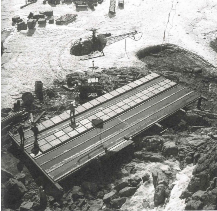
p.153 : Chantier du hall de préparation des fusées sondes Dragon, été 1966.