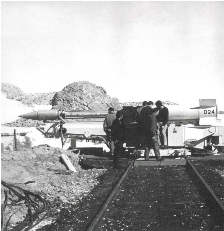
p.156 : La fusée-sonde Dragon couchée sur sa rampe de lancement au bout du chemin de fer, été 1967.