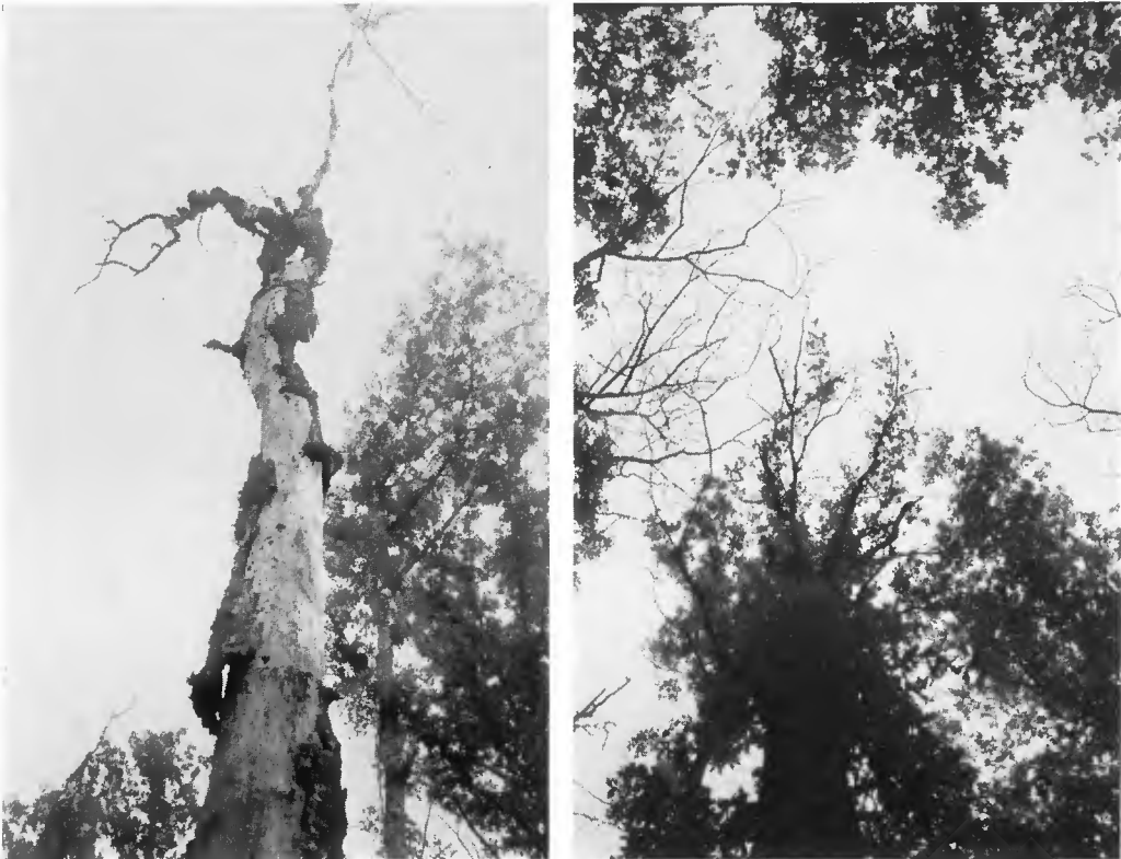
Chênes dépérissants (à droite). Stade avancé : arbres morts (à gauche).