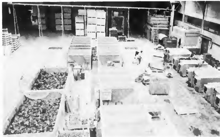
Cuves de thermothérapie et séchoirs.