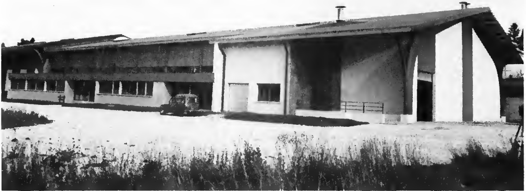
Vue extérieure de la sécherie de graines feuillues.