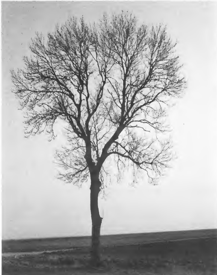
Frêne de bord de route. Port hivernal.

(1) des individus mâles (assez fréquents) ;