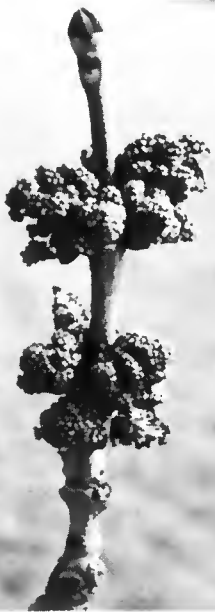
Inflorescence mâle. Forme globuleuse.