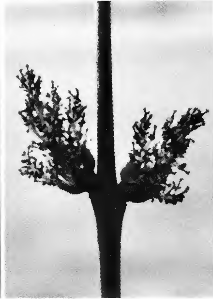
Inflorescence hermaphrodite. Forme intermédiaire.