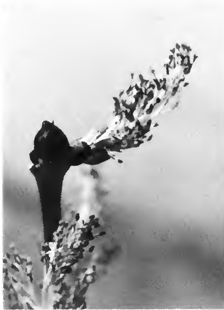
Inflorescence femelle. Forme très allongée.