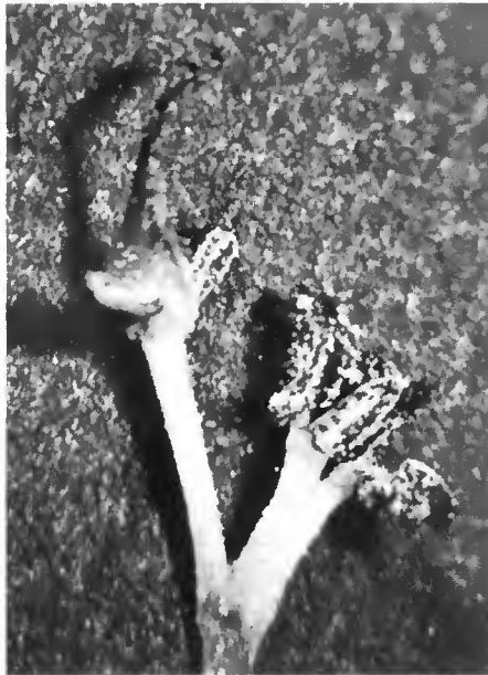
Inflorescence montrant une fleur hermaphrodite et un bouquet d'étamines (après émission de pollen).