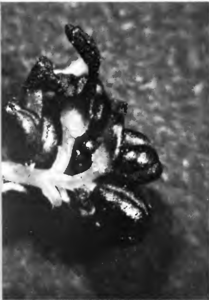
Inflorescence hermaphrodite à dominante mâle (avant émission de pollen).