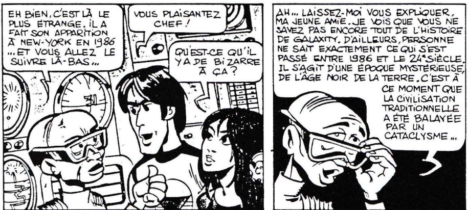
Valérian, la Cité des eaux mouvantes (Pierre Christin-Jean-Claude Mézières), 1968, © Dargaud.

La bande dessinée participe à l'émergence de cette nouvelle perception par ses marges avant-gardistes, avec la naissance des underground comics . Le futur que nous décrit Robert Crumb, dans le numéro zéro du légendaire ZAP comix (1967) n'est pas l'avenir enchanté des «Real life» comics. Sur un mode parodique, il nous présente le « big new wonderful tomorrow full of monumental achievements » 5 : on ne travaillera plus, des ordinateurs-robots assumeront toutes les tâches, les voitures seront en plastique mou pour éviter les accidents, on pourra être Jésus-Christ si on veut, ou mécanicien de locomotive, ou pute, ou gardien de camp de concentration avec des exécutions de masse ; et puis comme il faudra aussi réguler la croissance de la population, à 65 ans, des clowns hilares vous feront goûter une tarte au cyanure ! Les thèmes contestataires s'introduisent ensuite dans la bande dessinée établie, en commençant par la plus ouverte sur son temps : quand Pilote accueille dans ses pages Valérian et Laureline, agents spatio-temporels , le tournant est pris.