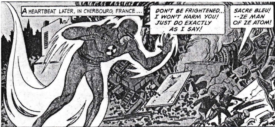
Doctor Solar, the Man of the Atom (anonyme), 1965, copyright Western Publishing Co. Inc.

Soumis un jour à la puissance formidable et inédite de l'atome, les super-héros deviennent des mutants positifs. Le thème atomique n'est peut être pas autre chose, dans la culture populaire, qu'un retour à l'alchimie : transmutation du corps, et élixir de longue vie. On sait que Spiderman , alias Robert Parker étudiant en sciences, a acquis ses propriétés particulières (s'accrocher aux murs, déplacer quarante fois son poids, atteindre le troisième étage d'un seul bond) grâce à la morsure d'une araignée soumise accidentellement à une dose inconnue de radiations. Magie et science sont ici intimement mêlées. De telles niaiseries ne sont en fait "crédibles" qu'enrobées dans un discours pseudo-scientifique, rendu possible par la croyance que la nouvelle ère atomique a reculé à l'infini les frontières du possible. Une telle croyance repose à l'évidence sur un noyau rationnel : l'optimisme scientifique qui a accompagné les «Trente glorieuses» et dont les scientifiques eux-mêmes se sont fait les propagateurs 4 . L'espace et la matière nous étaient ouverts. On entrait donc dans un monde merveilleux , dans la double acception du terme.