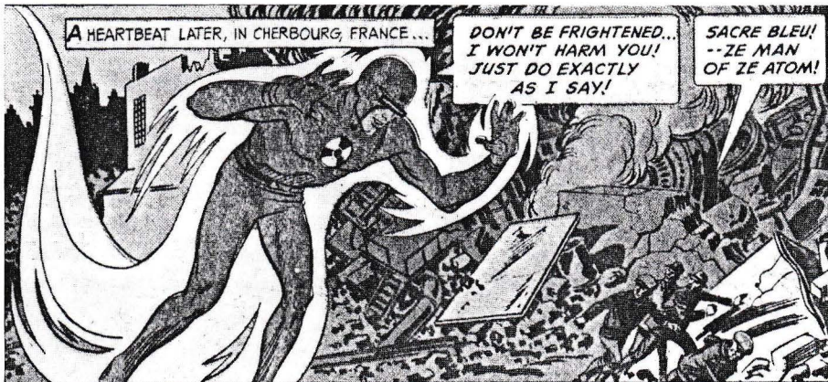
Doctor Solar, the Man of the Atom (anonyme), 1965, copyright Western Publishing Co. Inc.

Soumis un jour à la puissance formidable et inédite de l'atome, les super-héros deviennent des mutants positifs. Le thème atomique n'est peut être pas autre chose, dans la culture populaire, qu'un retour à l'alchimie : transmutation du corps, et élixir de longue vie. On sait que Spiderman , alias Robert Parker étudiant en sciences, a acquis ses propriétés particulières (s'accrocher aux murs, déplacer quarante fois son poids, atteindre le troisième étage d'un seul bond) grâce à la morsure d'une araignée soumise accidentellement à une dose inconnue de radiations. Magie et science sont ici intimement mêlées. De telles niaiseries ne sont en fait "crédibles" qu'enrobées dans un discours pseudo-scientifique, rendu possible par la croyance que la nouvelle ère atomique a reculé à l'infini les frontières du possible. Une telle croyance repose à l'évidence sur un noyau rationnel : l'optimisme scientifique qui a accompagné les «Trente glorieuses» et dont les scientifiques eux-mêmes se sont fait les propagateurs 4 . L'espace et la matière nous étaient ouverts. On entrait donc dans un monde merveilleux , dans la double acception du terme.