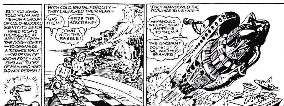
Buck Rogers au 25 e siècle (Phil Nowlan-Dick Calkins), 1934, © Malibu Graphics.

Ray Bradbury, préface à Buck Rogers au XXV e siècle .