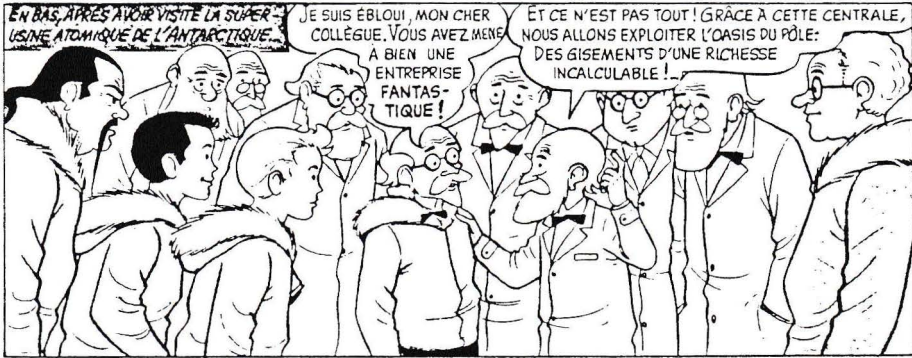
Nic et Mino, Un appel de l'Antarctique (Jean Ache-Claude Dupré), 1959, © Walt Disney Prod.

du progrès. Nic et Mino, de Jean Ache, se retrouvaient au cœur de l'Antarctique, avec leur savant ami, le professeur Grossetête, dans une usine atomique qui devait permettre d'exploiter «des gisements d'une richesse incalculable: de l'or, de l'uranium, du pétrole...» A l'heure où, sous la houlette du commandant Cousteau, des enfants des cinq continents prennent possession de l'Antarctique au nom des générations futures, refusant que la dernière terre vierge de la planète soit livrée au pillage industriel 1 , les pérégrinations atomiques de Nic et Mino au pôle sud, paraissent singulièrement désuètes.