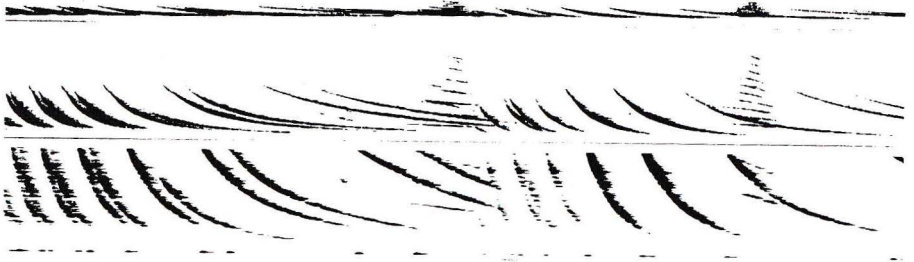
Fig. 3 : Représentation graphique du début du Moments Newtoniens n° 1 (les fréquences composantes sont représentées en fonction du temps ; cette figure englobe environ une minute de son). Sur le graphique du bas, les fréquences de 50 à 500 Hz, au milieu les fréquences de 200 à 2000 Hz, en haut de 1000 à 10 000 Hz. Il est difficile de représenter de tels sons "glissants" sur une partition conventionnelle : en fait, la représentation ci-dessus a été proposée pour remplacer la partition, à des fins de copyright, pour des sons électroniques ou numériques. (Communiqué par Jon Appleton)

Dans le troisième moment ( Trajectoires ), il est fait référence aux travaux de Newton sur la dynamique des corps. Le mouvement y est continu - la mécanique newtonienne ne fait plus de différence essentielle entre mouvement et repos. Des sons tournent sur eux-mêmes, mais leur rotation, graduellement ralentie, est peu à peu perçue comme une chute de hauteur — allusion à l'unicité découverte par Newton entre gravitation et pesanteur : pour un corps céleste attiré par un autre, chute et satellisation correspondent aux mêmes forces gravitationnelles, mais pour des conditions initiales différentes de position et de vitesse. Les sons tournants évoquent des spirales, courbes qui ont joué un grand rôle dans les polémiques du XVIIe siècle sur les mouvements d'un corps tombant vers la Terre qui bouge 4 . La bande, autour de laquelle s'inscrivent des interventions restreintes des instruments, présente ensuite des sons fixes ou voyageant dans l'espace sur des ellipses, et qui échappent à l'unidimensionnalité traditionnelle des hauteurs et des durées : sons qui descendent la gamme tout en devenant plus aigus, qui accélèrent sans fin, qui accélèrent et