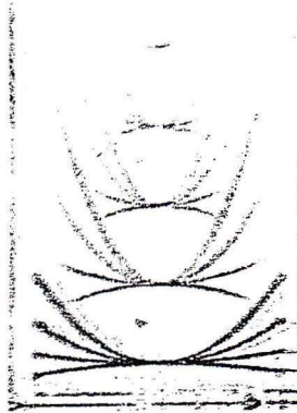
fig 1. Sons "tangents", Moments newtoniens , J-C Risset.

Le sonographe réalise une sorte de photographie du son. Il représente, en fonction du temps, les fréquences composant le son.