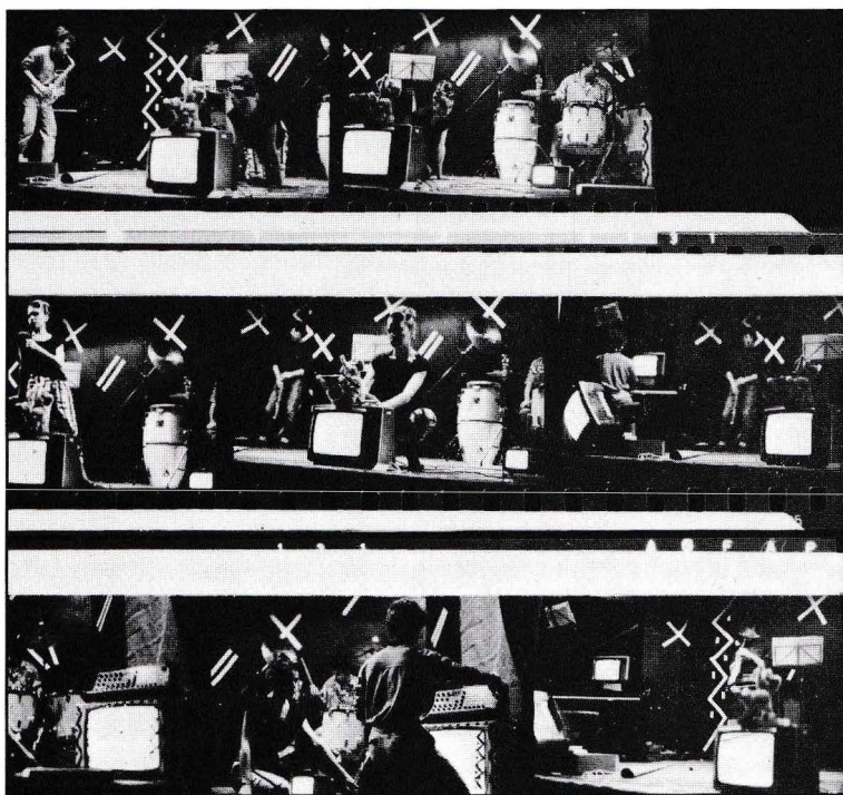
Concert-performance Rufyssc et Co. , Saint-Raphael