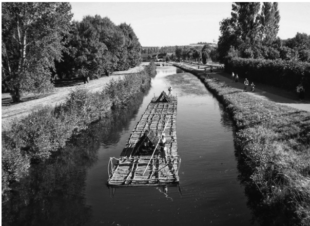
FIG. 4. — Part-de-train (36 m) : réplique de train de bois réalisée par l'Association Flotescale ( www.flotescale.org ).