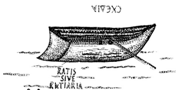
FIG. 1. — Représentation d'une schedia sur la mosaïque d'Althiburus.

tirerait précisément son nom du « ponton » qui franchissait le fleuve à cet endroit (6) . Cette Schedia est mentionnée dans les sources papyrologiques très tôt, mais comme le relevait P. Sijpesteijn, qui s'est aussi penché sur la question de la différenciation entre le toponyme et le nom commun σχεδία , on peut s'appuyer sur la présence de l'article pour distinguer le nom commun du toponyme (7) . Mais si c'est bien un nom commun, faut-il y voir alors un radeau, un ponton ou encore un bateau ? Ce dernier sens a en effet été relevé à juste titre par les éditeurs d'un ostracon du désert Oriental daté du III e mentionnant des σχεδία qui ne seraient pas encore arrivées à Myos Hormos, et une expédition de poisson, qui serait apparemment soumise à l'arrivée des mêmes σχεδία ( SB XXII 15452 , l. 3-5) (8) . Les éditeurs, qui traduisaient en l'occurrence le terme par « bateaux », justifiaient leur traduction en s'appuyant notamment sur la mosaïque contemporaine d'Althiburos (Tunisie), et son commentaire par P. Gauckler (9) : la première des embarcations représentées sur cet inventaire de batellerie porte en effet une légende bilingue, indiquant en grec ΣΧΕΔΙΑ et en latin ratis sive ratiaria (fig. 1).