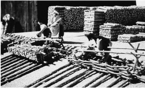
FIG. 3. — Atelier d'assemblage des bois en « branches ». Carte postale (détail) < http://lemorvandiaupat.free.fr/flotteurs.html >.