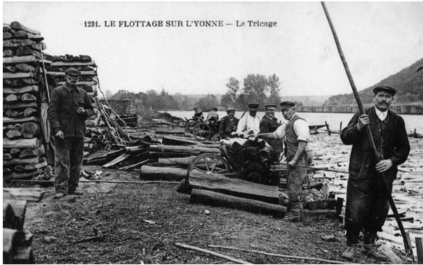
FIG. 2. — Triage du bois sur l'Yonne. Carte postale.