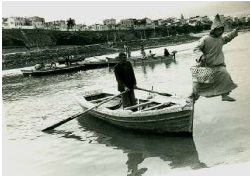
1. Les passeurs en barques (inconnu, sans date)

La configuration de ces espaces est commune à plusieurs villes du Maghreb et d'Europe. À ce propos, Barthel et Signoles (2006) notent au sujet de la corniche du Lac de Tunis, que la lagune fut bien représentée, dans la littérature, comme un espace de marginalité économique et sociale. En effet, Alexandre Dumas soulignait déjà en 1846 qu'« un Européen qui se hasarderait la nuit, sur ce terrain vague qui s'étend des murailles de la ville aux rives du lac, serait infailliblement dévoré par les chiens qui le peuplaient » (Dumas cité par Santelli, p. 59). De son côté, Jolé (2006, p. 121) souligne que le canal Saint Martin à Paris « était avant tout un lieu de travail et, pour la rumeur populaire et romanesque, le lieu du crime et des cadavres repêchés ».