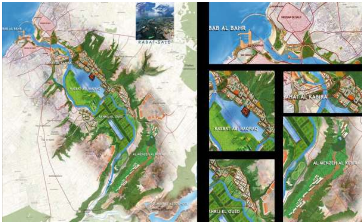
3. Parti d'Aménagement Global (PAG) de la vallée Bouregreg

Le périmètre d'aménagement du projet est subdivisé en six séquences consécutives. La séquence Bab Al-Bahr [Porte de la Mer], qui nous intéresse ici, est le premier jalon du projet censé créer une nouvelle centralité. Les premiers espaces publics relevant de cette séquence ont été livrés en 2007, dont le quai de Rabat, qui en constitue un des principaux éléments. Le quai est constitué d'une promenade, en partie accostable, le long de l'oued Bouregreg. C'est désormais une voie piétonne sur berge, longue de 1,5 km, dotée de restaurants-cafés sur terre et sur pilotis. Un débarcadère est réservé aux barcassiers [ flaikiias ] qui, depuis toujours et pour quelques dirhams, assurent la traversée entre Rabat et Salé à partir de plusieurs points d'amarrage. Le quai a été aménagé selon des standards internationaux classiques, c'est-à-dire avec un mobilier urbain, des matériaux et des éclairages que l'on peut retrouver sur tous les waterfront de la planète (Chaline, 1994, 1998) : pavés, rambardes de protection en style passerelle de paquebot, luminaires design, etc.