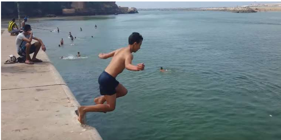
4. La baignade dans le Bouregreg, une scène immanquable sur le quai de Rabat pendant l'été. (Moussalih, 2014)

En se donnant en spectacle, ces adolescents, sans toujours le savoir, perpétuent ainsi l'ancienne pratique de la traversée du Bouregreg à la nage, même s'ils se limitent au plongeon sous les applaudissements et les encouragements des spectateurs et de leurs ami(e)s.