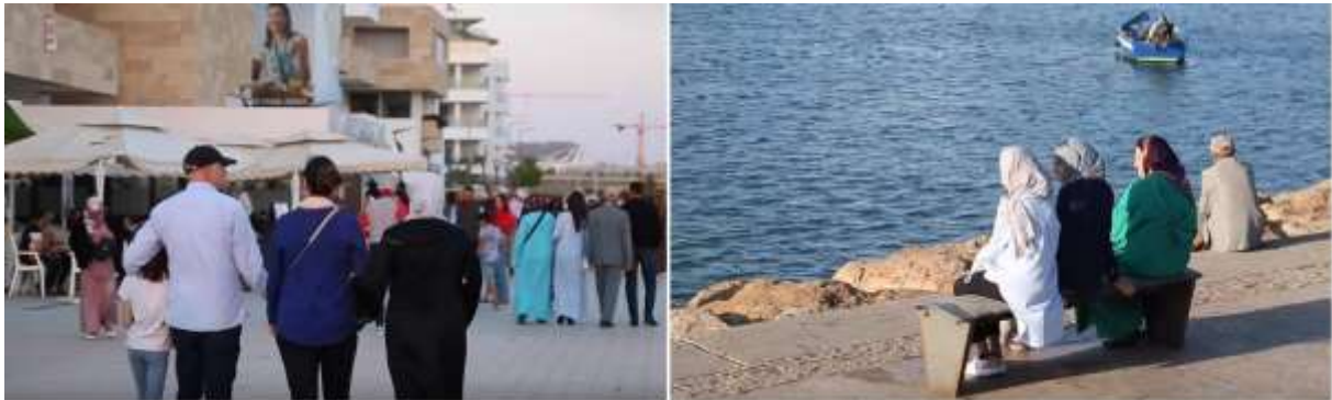
6. La promenade et le code vestimentaire comme formes d'urbanité et de liberté (Moussalih, 2014)

Dans une tenue qui révèle une recherche d'élégance, les usagers investissent largement ces espaces. Le code vestimentaire, à travers son usage classique et traditionnel, avec ajustement (maquillage, foulard, djellaba, longueur des jupes) ou hybridations (hijab, maquillage et vêtement près du corps), constitue une façon de s'exprimer, un langage. Il fournit une multitude d'indices sur le sens du lieu chez ses usagers. Car pour eux, se rendre sur le quai de Rabat, c'est participer à un lieu de valeur dans la ville (figure 6).