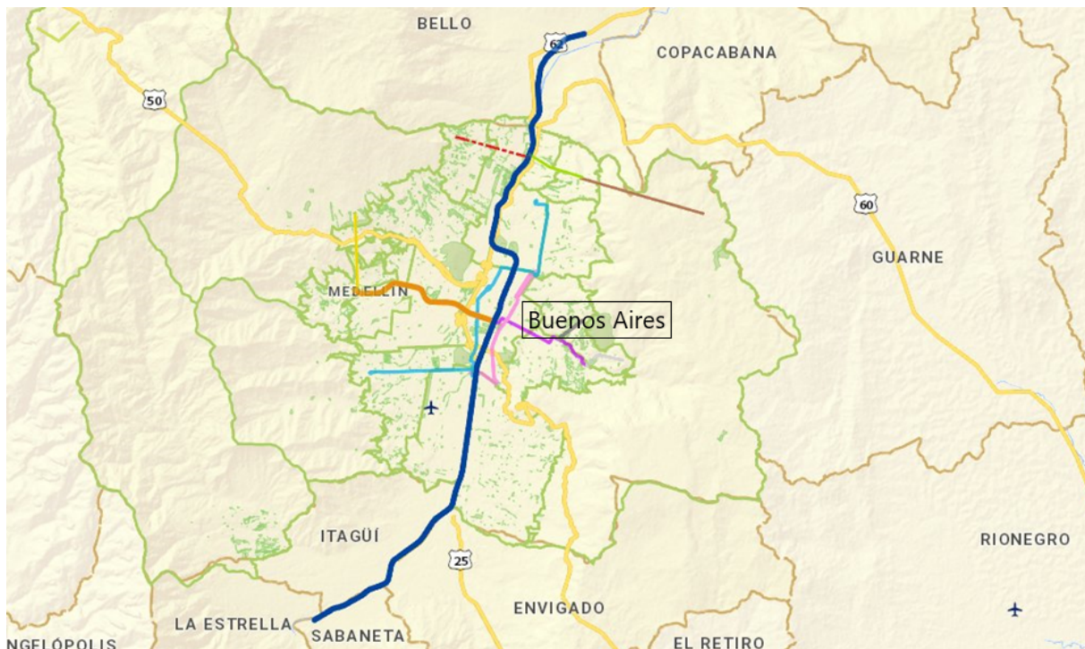
1. Carte des transports de la ville ( Mapas Medellín , 2018)

L'urbanisme social à Medellín consiste en un ensemble de politiques urbaines destinées à désenclaver les quartiers périphériques, à lutter contre l'exclusion sociale et à renforcer le système éducatif. C'est Sergio Fajardo, maire de la ville de 2004 à 2007, qui a popularisé ce terme d'urbanisme social, repris ensuite par ses successeurs. L'outil central de ces politiques est le projet urbain intégral, et l'infrastructure de transport en constitue l'épine dorsale. La ville a vu s'élever sur ses flancs cinq lignes de téléphérique en moins de quinze ans, qui viennent alimenter les deux lignes de métro qui traversent la ville du nord au sud et de l'ouest au centre (voir fig. 1). Ces infrastructures s'imposent dans le paysage urbain et le modernisent, attirant la curiosité des visiteurs, locaux et étrangers. La municipalité a d'ailleurs profité de l'originalité d'un téléphérique en zone urbaine pour en faire un lieu de tourisme à part entière.