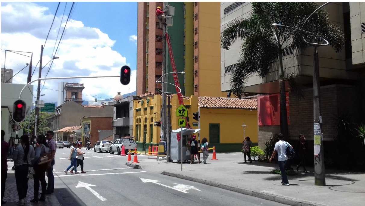
4. Les maisons traditionnelles à l'ombre des grandes tours (Maëlle Lucas, septembre 2017)

La verticalisation est encouragée par l'arrivée du tramway qui modernise le quartier et accélère le processus de transformation. Le contraste généré par l'élévation des bâtiments est visible lorsque l'on parcourt la rue d'Ayacucho, en particulier depuis les arrêts de tramway les plus hauts sur la rue vers le centre de la ville. On observe les maisons traditionnelles, ornées de peintures et de moulures, qui sont parfois dans l'ombre des tours récentes, qui ponctuent la ligne constituée par le couloir du tramway (voir fig. 4).