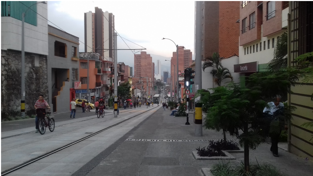
Couverture : Usages de l'espace public aménagé et contrastes architecturaux (Maëlle Lucas, septembre 2017)

Pour citer cet article : Lucas M., 2019, « La “Culture Metro” à Medellín, matérialisation du droit à la ville ou instrument de transformations des pratiques urbaines ? », Urbanités , #11 / Bouger en ville, en ligne .