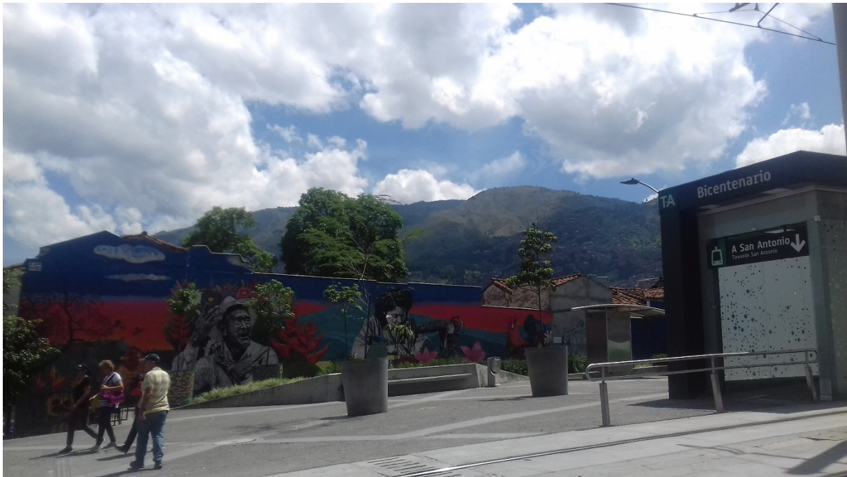
5. Fresque aux abords d'une station de tramway (Maëlle Lucas, septembre 2017)

circulation des voitures. Le programme « Ayacucho te quiero mucho » , porté par l'entreprise Metro, est à l'origine de la rénovation des façades et des fresques.