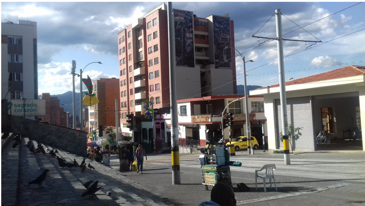
6. Vendeurs informels aux abords du tramway (Maëlle Lucas, octobre 2017)

L'un des enjeux du territoire traversé par le tramway est commercial. La rue d'Ayacucho est passante et les commerces y sont installés de longue date. Avant les travaux de construction du tramway, de nombreux vendeurs ambulants avaient une position relativement stable et régulière le long de la rue et les riverains, autant que les gens de passage, venaient consommer la « chunchurria 4 », réputée dans toute la ville. Ces commerces de rue informels ont presque disparu aujourd'hui. Ils se concentrent dans quelques rares secteurs de la rue (voir fig.6). Il est difficile d'établir des statistiques fiables et de donner des chiffres, justement en raison de cette informalité. L'arrivée du tramway confirme des tendances déjà à l'œuvre ou sous-jacentes. C'est le cas ici avec la disparition progressive des commerces informels de rue, dont l'existence est de plus en plus encadrée par les autorités publiques. La fuite des commerces ambulants permet d'attirer de nouveaux visiteurs et habitants, plus aisés, qui consomment différemment. Une habitante rapporte dans un entretien que le prix moyen d'un repas est d'ailleurs passé d'environ 7 000 à 13 000 pesos colombiens 5 entre 2012, date de début des travaux, et 2017.