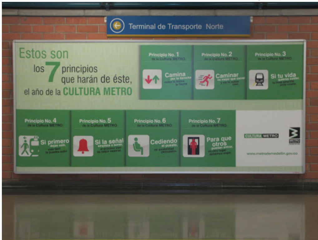
3. Affiche du programme « Culture Métro » 2