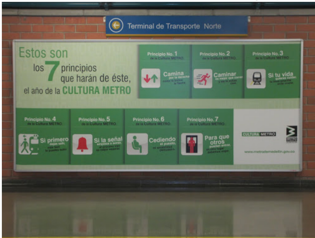
3. Affiche du programme « Culture Métro » 2