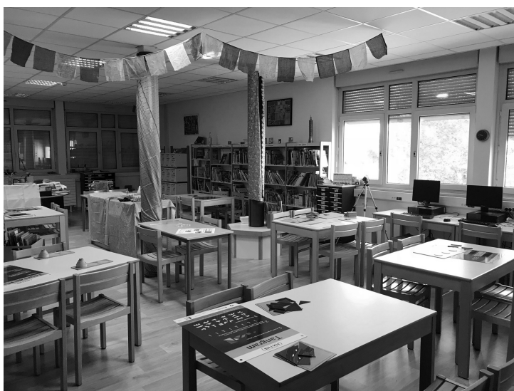
Figure 1. – Organisation spatiale de l'exposition.