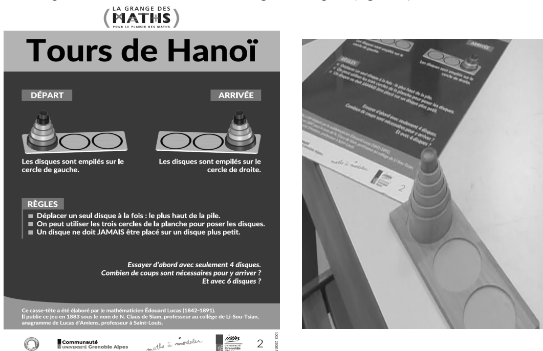
Figure 2. – Panneau décrivant la situation des Tours de Hanoï proposée par la Grange des Maths et son matériel associé.

Dans ce dispositif nous avons analysé principalement 4 situations issues de la SFR Maths à Modeler et de la Grange des Maths. Notre choix s’est alors porté sur des Situations de Recherche en Classe (SiRC), comme le pavage de grilles rectangulaires avec un trou par des dominos de taille 2 \times 1 ou 1 \times 2 (Grenier et Payan, 1998). Mais aussi, sur des situations plus classiques comme les Tours de Hanoï par exemple 2 (figure 2).