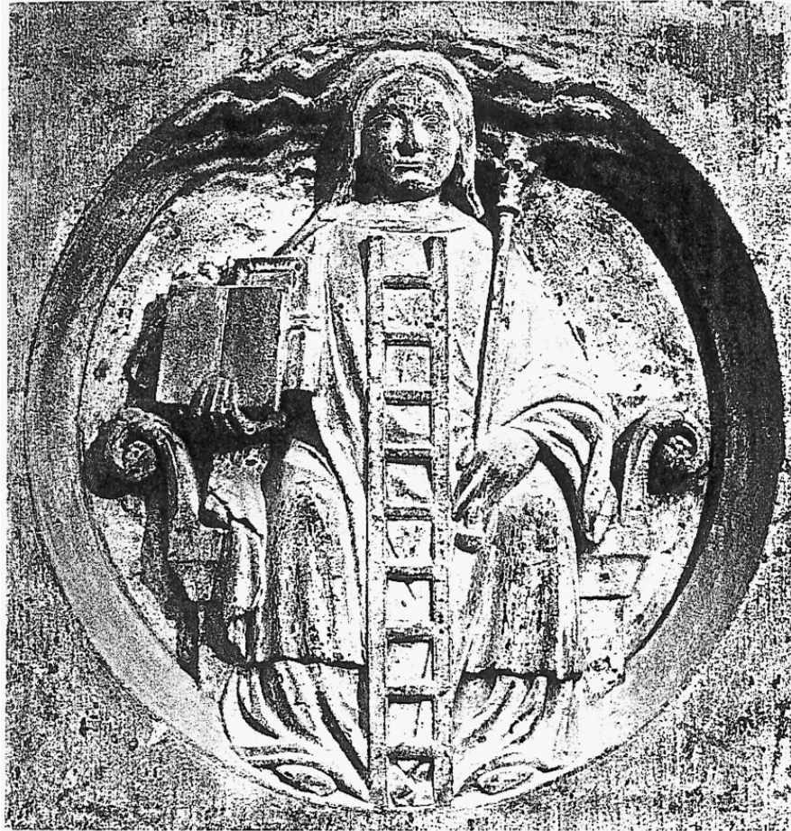
Illustration n° 1 : Bas relief du Grand Porche de Notre-Dame de Paris

catégorie n'hésite pas par exemple à s'instruire de l'Œuvre, et à visiter le portail de la cathédrale Notre-Dame de Paris, le livre de Fulcanelli à la main 32 . Nous avons pu en rencontrer en Franche-Comté visitant certains sites marqués par le Grand Œuvre.