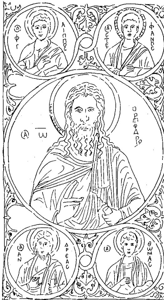
Illustration n° 2 : Tirée de Les Rose-Croix , J-P Bayard, MA Éditions.

Nous avons pu évoquer l'importance de la découverte « par soi-même » du message, mode qui s'oppose résolument à « un monde moderne 44 » qui semble parfaitement lisible car l'exotérisme « donne trop facilement les choses au gens » comme nous le disait un alchimiste.