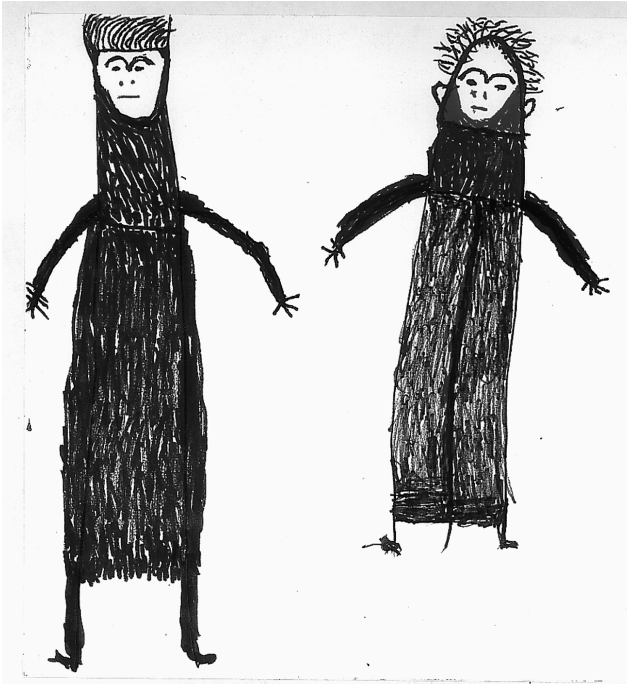
Planche 1. — Auteur : Carolina, 80 ans.