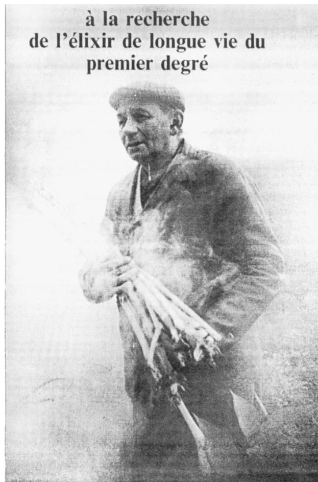
Illustration n° 3 : Tiré de Armand Barbault, L'or du millième matin , Paris, Dervy Livre, 1987.

Le travail sur la matière première, quasi métaphoriquement fécale (ordure), et donc là encore opposable structurellement à l'Or qui est l'aboutissement de la quête alors que l'Ordure en est le début, se fait suivant plusieurs voies. Les voies dites humides et sèches, assimilées aux couleurs rouge et noire, mais aussi liées aux processus par lesquels les éléments sont travaillés (feu ou pourrissement). On parle aussi de voie lente et rapide. Ainsi le travail alchimique, toujours décrit grâce à des métaphores, des périphrases et des images, mêle tous les éléments d'une herméneutique dans une cosmologie complexe mais concrète, car ayant toujours comme fondement le travail opératif de l'alchimiste.