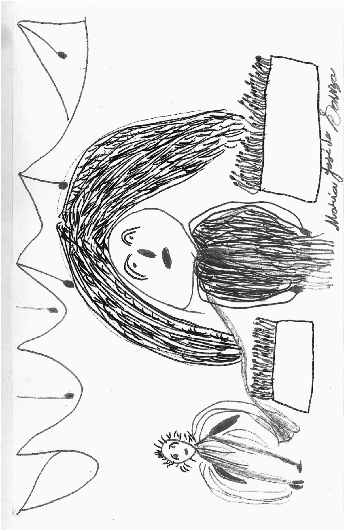
Planche 3. — Auteur : Zezé, 67 ans.