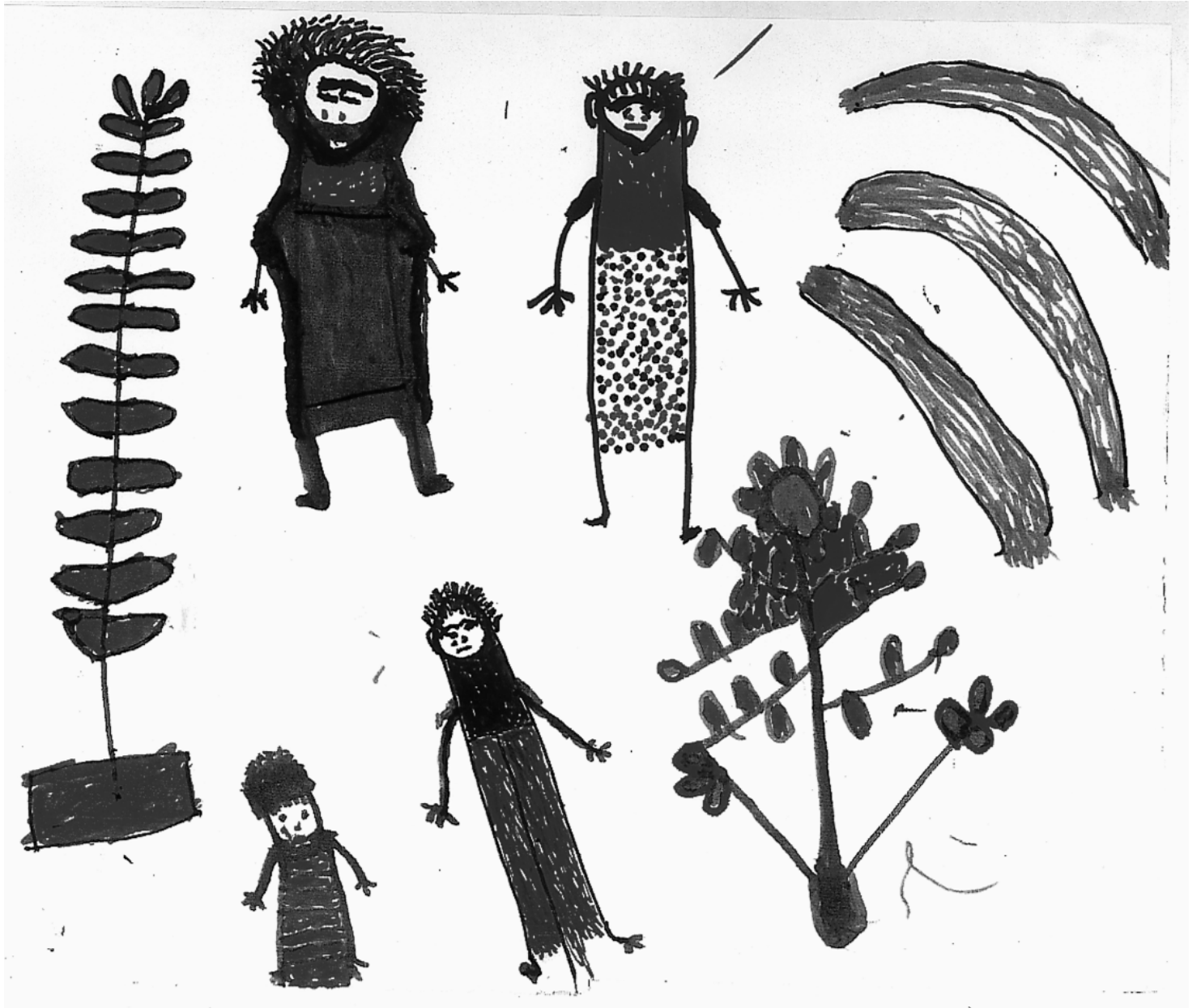
Planche 2. — Auteur : Carolina, 80 ans.