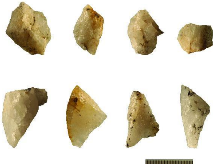
Figure 3. Outils en quartz taillé de la formation de Shungura, basse vallée de l'Omo, Sud-Ouest éthiopien, bassin du lac Turkana.