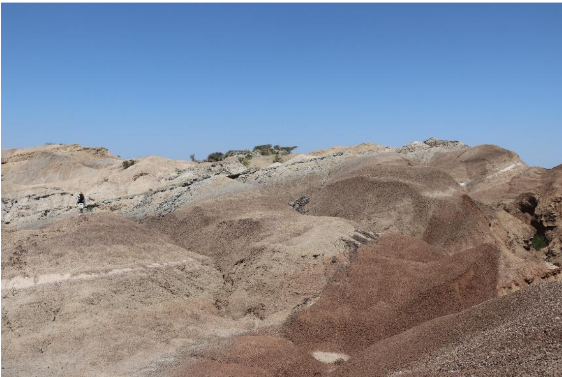
Figure 4. Dépôts sédimentaires du grand rift africain (formation de Shungura, basse vallée de l'Omo, dépression du Turkana). Le niveau gris, sous la végétation, contient des cendres volcaniques datées entre 1,411 Ma et 1,355 Ma.