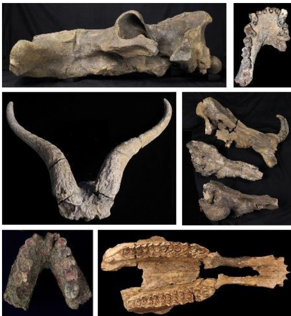
Figure 2. Fossiles du grand rift africain. De gauche à droite et du haut vers le bas : crâne d'hippopotamidé (2,6 Ma), mandibule de cercopithécidé (1,4 Ma), crâne d'antilope réduncine (2,1 Ma), crânes de suidés (0,8 Ma pour le crâne du haut, 1,5 Ma pour les deux autres), mandibule de Paranthropus (2,1 Ma), palais d'équidé (1,8 Ma).