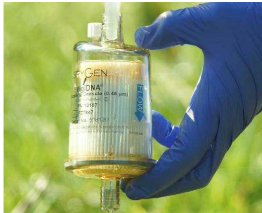
Figure 1 : Capsule de filtration VigiDNA® - porosité 0,45 \mu\text{m}

Quel que soit le type de milieu aquatique étudié, l'échantillonnage consiste à filtrer de l'eau au travers d'une capsule contenant une membrane à très faible porosité. La porosité de cette membrane joue un rôle crucial dans la capacité à capturer l'ADN en fonction du milieu étudié. Pour les cours d'eau de Nouvelle-Calédonie, la porosité de 0,45 \mu\text{m} a été validée pour une détection optimale des espèces de poissons dulçaquicoles (Grondin et al , 2019).