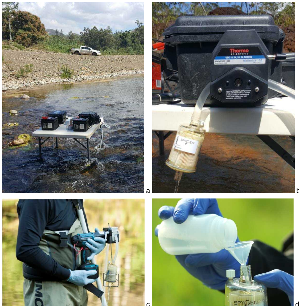
Figure 2 : Protocole d'échantillonnage en milieu aquatique courant consistant i) à filtrer de l'eau à travers une capsule de filtration (VigiDNA® 0,45 µm) à l'aide d'une pompe péristaltique (a, b, c) et ii) à remplir la capsule avec une solution de conservation VigiDNA® CL1 Buffer (d).

Dans le cadre de l'étude menée par SPYGEN et Bio eKo, les filtres VigiDNA® 0,45 µm et la solution tampon VigiDNA® CL1 Buffer ont été utilisés. Cette solution tampon permet une conservation à température ambiante. Cette étude a permis de mettre en évidence que deux réplicats permettent d'être très représentatif des communautés de poissons présentes sur le site étudié (94,2 % de la richesse totale) Cet effort d'échantillonnage permet également d'optimiser les moyens matériels, humains et le coût des analyses associées.