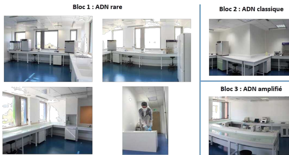
Figure 3 : Présentation des laboratoires SPYGEN.

Le personnel doit aussi disposer d'un équipement adapté (combinaison, gants, masque, charlotte et surchaussures à usage unique).