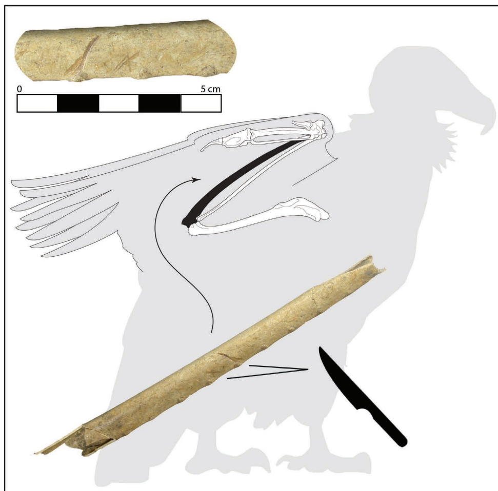
Fig. 4 Diaphyse d'ulna de vautour moine, présentant des stigmates de découpe. Tour de Broue (Saint-Sornin, Us 1158), XIII e -XIV e siècle (DAO B. Clavel).

à placer ces éléments aux pieds des parturientes pour faciliter l'accouchement. Cette croyance, qui prend racine dans l'Antiquité, se trouve notamment rapportée par Pline l'Ancien, dans son Histoire naturelle 36 , et semble connaître une certaine faveur jusqu'au Moyen Âge 37 , malgré la rareté des sources textuelles l'attestant. L'un des rares témoignages auxquels nous ayons eu accès, signalé par l'ethnologue Paul Sébillot 38 , se trouve sous la plume du franciscain anglo-normand Nicole Bozon. Ses Contes moralisés , rédigés entre 1320 et 1350, laissent penser que les propriétés des plumes de vautour, telles que vantées par les Anciens, ne sombrent pas dans l'oubli au cours des temps médiévaux : « Si femme travaille de enfant e ne peot delivrance aver, pernez un penne ou deus de un oysel q'est appellé voutre, e fetez lier al pié senestre de ceste femme travaillant,