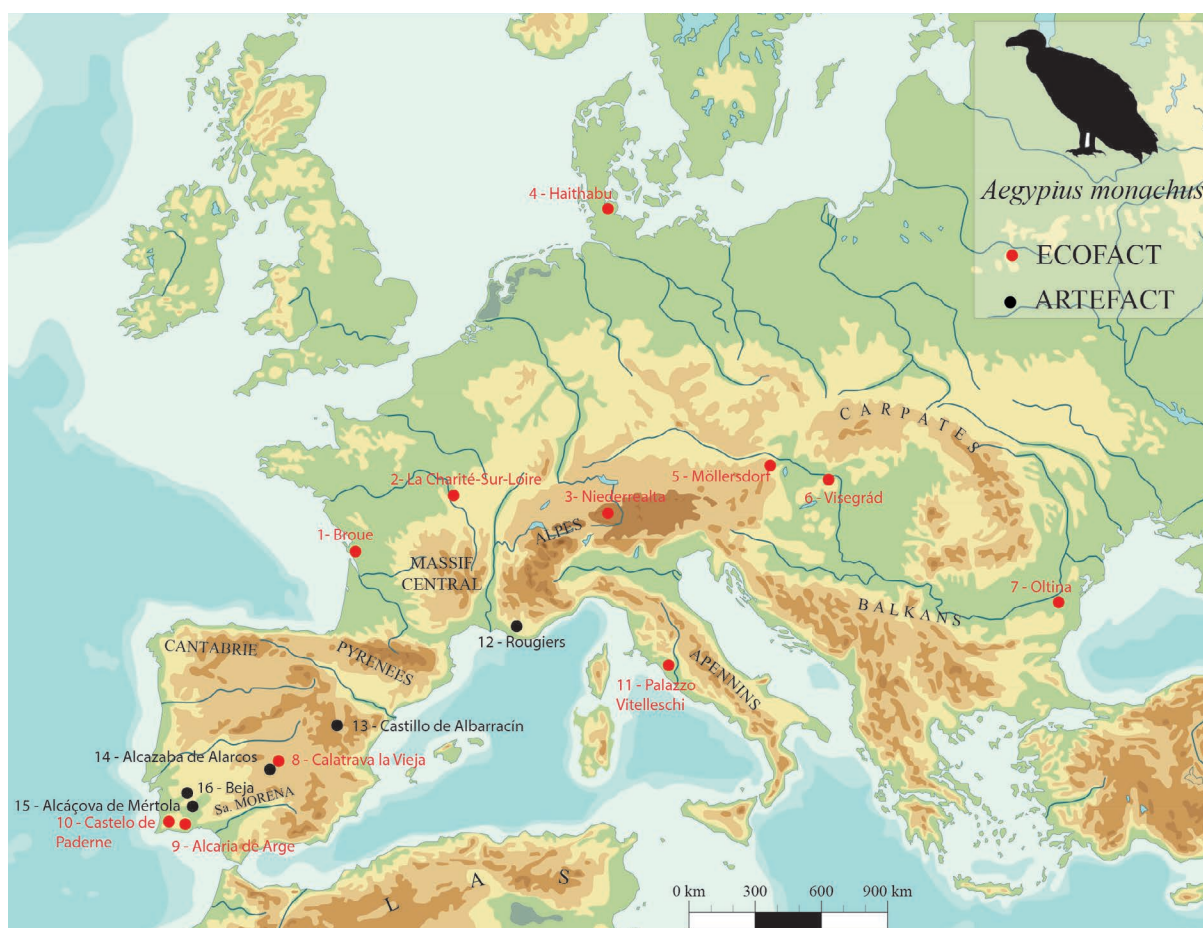
Fig. 2 Distribution des restes de vautour moine ( Aegypius monachus , écofacts et artefacts) au cours des périodes médiévale et moderne (d'après AUDOIN-ROUZEAU 1993; DÉMIANS D'ARCHIMBAUD 1980; JOURDAN 1980; GÁL, STANC, BEJENARU 2010; HERNÁNDEZ CARRASQUILLA 1993; ID. 1994; MORENO-GARCÍA, PIMENTA, GROS 2005; MORENO-GARCÍA, PIMENTA 2006; MORENO-GARCÍA, PIMENTA 2007b; MORENO-GARCÍA, PIMENTA 2010; PIMENTA, MORENO-GARCÍA 2010; PIMENTA, MORENO-GARCÍA, LOURENÇO 2015; DAO : B. Clavel).