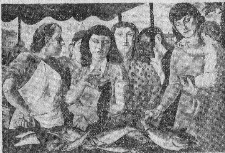
FOUGERON. — « Le Marché aux poissons. »

l'action du capitaine Fedotov et l'évolution de la peinture russe vers un réalisme socialiste (?), donnons pour sous-titre à l'œuvre de Fougeron « Le dernier maquereau coûte deux cents francs ». Un groupe de cinq ménagères, fascinées par une poissonnière, s'érige devant la marée étalée. Une terrible angoisse fige ces prolétaires. « Vous vous rendez compte ! » soupire l'une. Celle-là, porteuse d'un enfant, d'une main palpe une rascasse, de l'autre — la pauvre ! — son porte-monnaie noir. Toile anecdotique du genre de celles qui sévissent depuis un siècle aux Artistes Français, reproduites en couleurs par l'Illustration , et dont nos commissions d'achat inondèrent si longtemps les musées de province. L'inégalité des conditions, la cherté