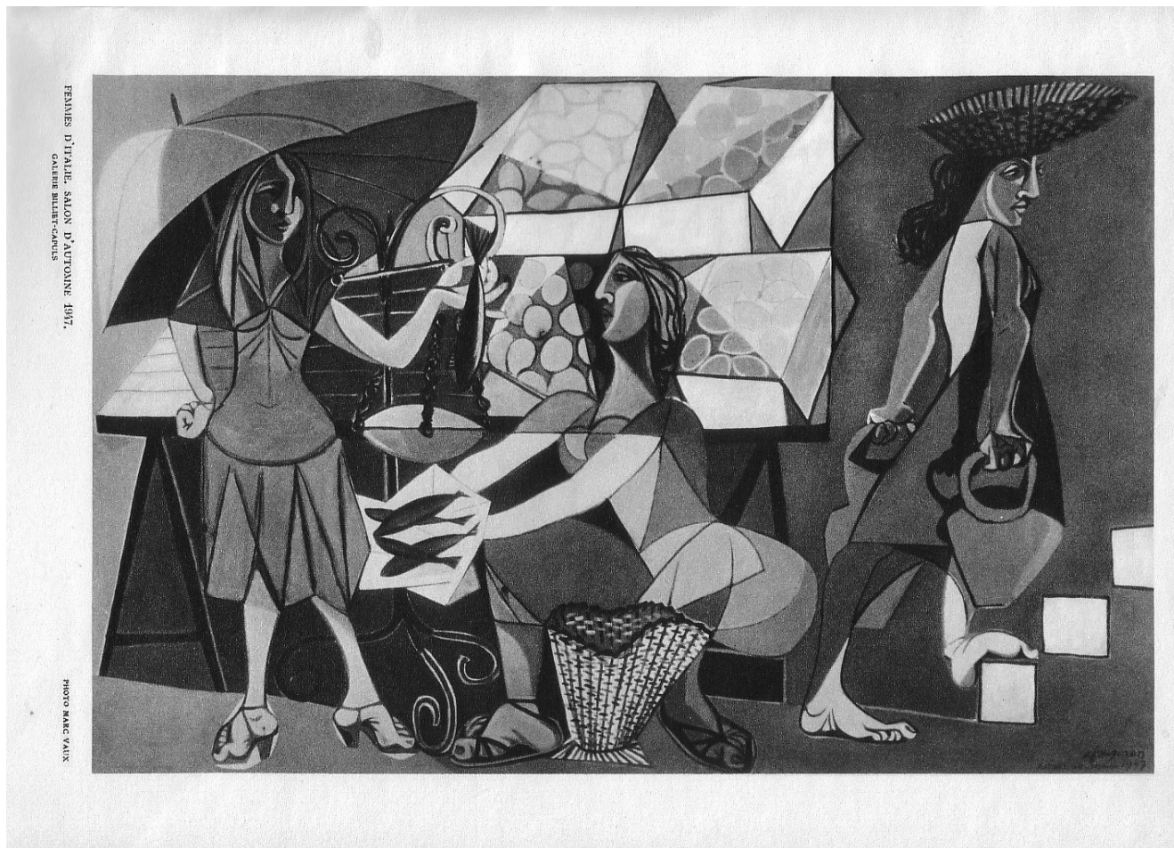
Figure 3. André Fougeron, Femmes d'Italie , 1947, huile sur toile aujourd'hui disparue, 200 x 300 cm. Planche extraite d'un fascicule de la revue Le Point (n° 36, 1948) ayant appartenu à André Fougeron.

chez Piero della Francesca comme dans les prédelles siennoises. La méditation sur les exhortations de Casanova précise la portée de la leçon italienne : la réalité est moins la transposition du réel que l'expression du drame qu'elle contient. Le réalisme renouvelé que recherche le peintre ne devra plus se contenter de dénoter le réel, mais de révéler le « drame de la réalité 37 » en donnant à voir et à sentir les luttes qui charpentent la vie sociale. Dans son atelier de Touraine, Fougeron peint Femmes d'Italie (Fig. 3), tableau qu'il présente au Salon d'Automne de 1947, dans lequel quelques rares poissons, des paniers et des cabas vides laissent penser que l'artiste voulait y dénoncer les difficiles conditions de