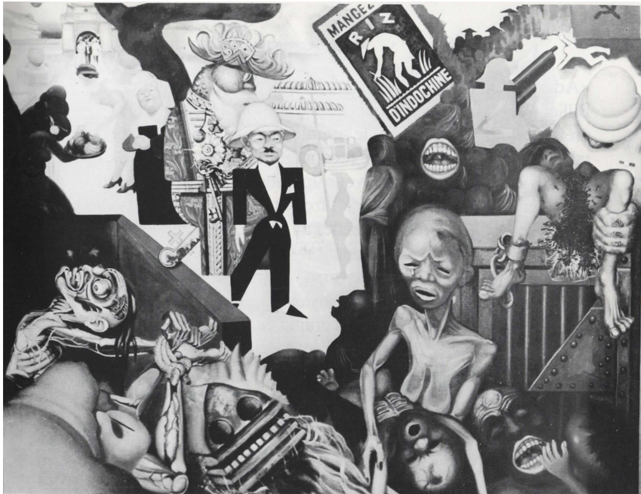
Figure 6. Adam, Le riz d'Indochine , 1934, huile sur toile, 130 x 162 cm. Planche extraite du catalogue d'exposition Adam. Présence de l'art dans la cité. Hommage de la ville d'Antony à un créateur , 1982.

anticapitaliste et anti-impérialiste à partir d'une imagerie narrative multiple 41 . André Fougeron ose une toile de rupture, néanmoins, comme toujours, il doute : « ...je me demandais, confie-t-il bien plus tard, si je ne me rapprochais pas de certaines formes utilisées par les surréalistes ou les dadaïstes. J'étais si peu sûr de moi que je l'ai présentée au Salon d'Automne de 1953 en lui opposant [une allégorie] Les Paysans français défendent leurs terres 42 », peinte selon une volonté démonstrative commune : protester contre la présence militaire américaine en France. Mais cette précaution ne suffit pas à Fougeron pour dévier les coups qui lui seront portés.