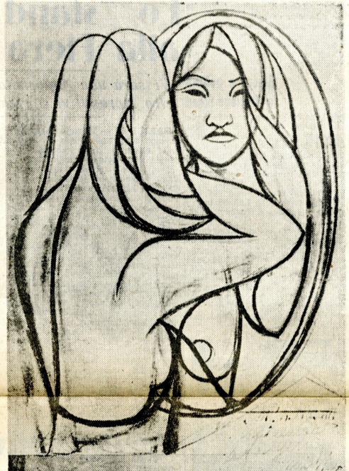
« Donna allo specchio » un disegno di André Fougeron