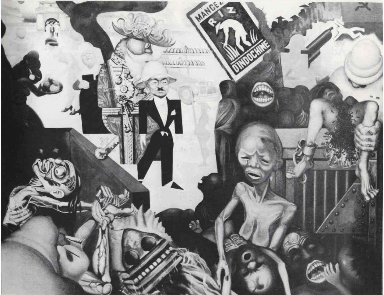
Figure 6. Adam, Le riz d'Indochine , 1934, huile sur toile, 130 x 162 cm. Planche extraite du catalogue d'exposition Adam. Présence de l'art dans la cité. Hommage de la ville d'Antony à un créateur , 1982.

anticapitaliste et anti-impérialiste à partir d'une imagerie narrative multiple 41 . André Fougeron ose une toile de rupture, néanmoins, comme toujours, il doute : « ...je me demandais, confie-t-il bien plus tard, si je ne me rapprochais pas de certaines formes utilisées par les surréalistes ou les dadaïstes. J'étais si peu sûr de moi que je l'ai présentée au Salon d'Automne de 1953 en lui opposant [une allégorie] Les Paysans français défendent leurs terres 42 », peinte selon une volonté démonstrative commune : protester contre la présence militaire américaine en France. Mais cette précaution ne suffit pas à Fougeron pour dévier les coups qui lui seront portés.