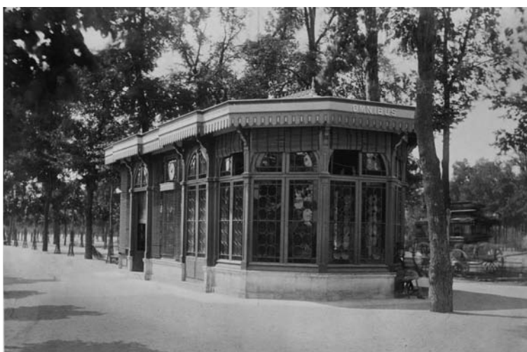
Fig. 4 – PH1682, Charles Marville, Bureau d'omnibus Petite Villette-Champs-Élysées, Cours-la-Reine , entre 1858 et 1871, tirage sur papier albuminé, 23.2 x 35,1 cm, (a) Musée Carnavalet, Histoire de Paris.

L'enseigne Métropolitain en lave émaillé n'étant pas prête pour l'inauguration, un portique de bois pavoisé a été installé devant l'édicule fermée (a) Musée Carnavalet, Histoire de Paris.