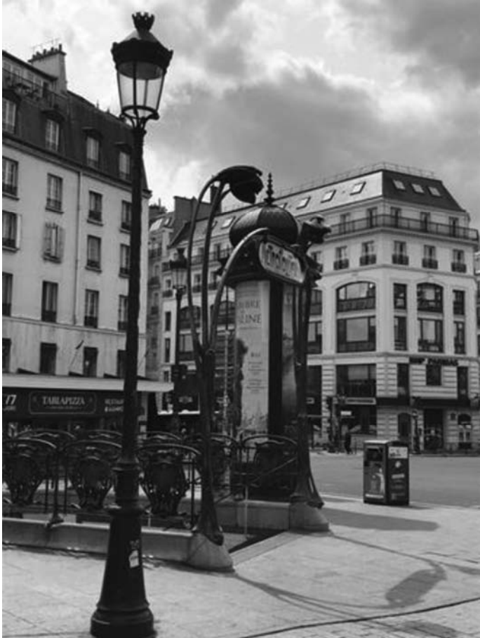
Fig. 7 – Entourage de la station « Place de Clichy » de la ligne 2, entre un réverbère parisien et une colonne Morris, 2020. (a) Collection privée