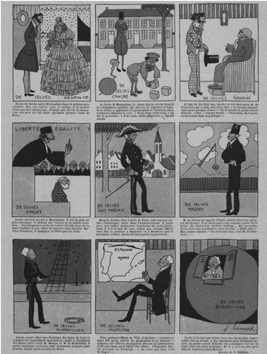
Fig. 2 – Joseph Hémard, « Le bon neveu de la souris blanche », Le Rire , 9 décembre 1911.

Cette bande dessinée illustre parfaitement le parcours type des hauts fonctionnaires de la IIIe République comme celui de Justin de Selves dans le sillage de son oncle Charles de Freycinet. https://gallica.bnf.fr/ark:/12148/bpt6k6265807j/f16.image.r=le%20rire%22justin%20de%20selves%22rk=21452