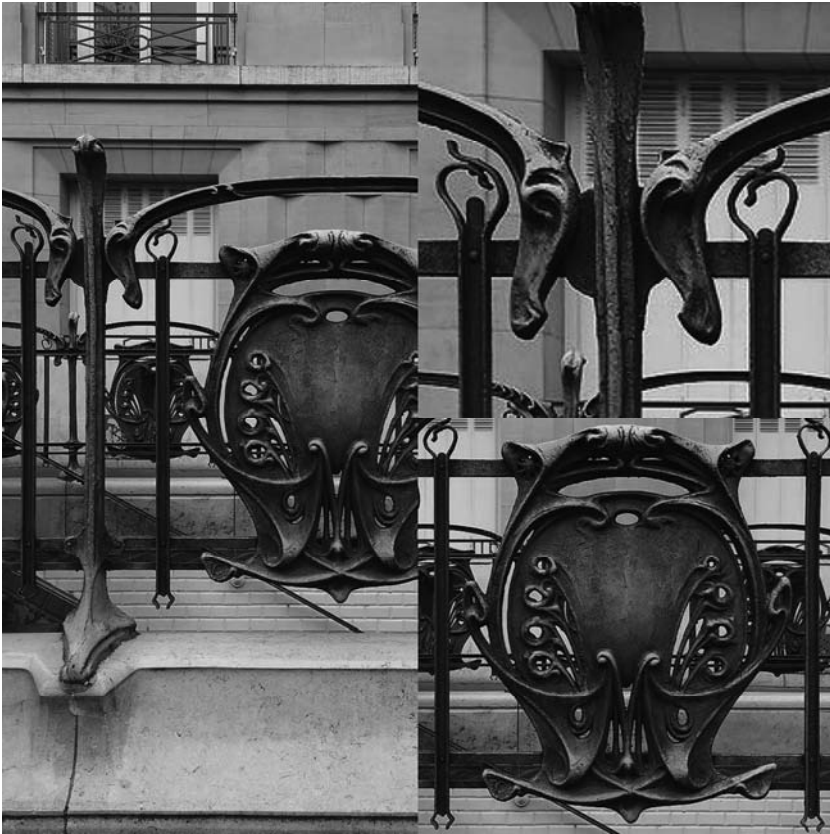
Fig. 10 – Détail des blasons des entourages Guimard.

Dominé par deux têtes d'équidés, deux C se faisant face entourent un M, encerclé par huit P opposés pour former l'acronyme CMP, Compagnie du chemin de fer du Métropolitain de Paris. (a) fluteric