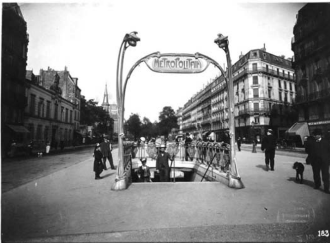
Fig. 9 – PH18767, Charles Maindron, Édicule Guimard. La station de métro Rome vers la Nation, Paris. 5 juin 1903, aristotype, 16.5 x 22,7 cm.

Le soubassement en forme de fer à cheval, la répétition des éléments constitutifs de la rambarde ainsi que le portique en forme de M symbolisent la raison sociale comme le service offert par la Compagnie du chemin de fer du Métropolitain de Paris (CMP). (a) Musée Carnavalet, Histoire de Paris.