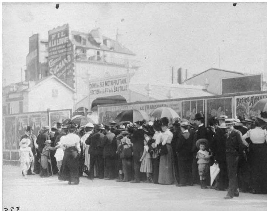
Fig. 1 – PH1201, Eugène Atget, Voyageurs et curieux à l'ouverture du métropolitain, place de la Bastille, Paris, août 1900, tirage sur papier albuminé, 17,4 x 21,9 cm.

En raison de trop courts délais pour la fabrication et l'installation des entourages Guimard, nombre de stations du métropolitain ouvrirent en août 1900 avec des accès en bois temporaires. (a) Musée Carnavalet, Histoire de Paris.