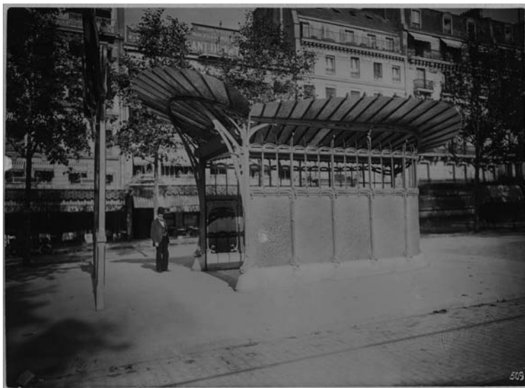
Fig. 3 – PH26145, Charles Maindron, Accès de la station Porte Maillot. Juillet 1900 , aristotype, 16.4 x 22,6 cm.

L'enseigne Métropolitain en lave émaillé n'étant pas prête pour l'inauguration, un portique de bois pavoisé a été installé devant l'édicule fermée (a) Musée Carnavalet, Histoire de Paris.