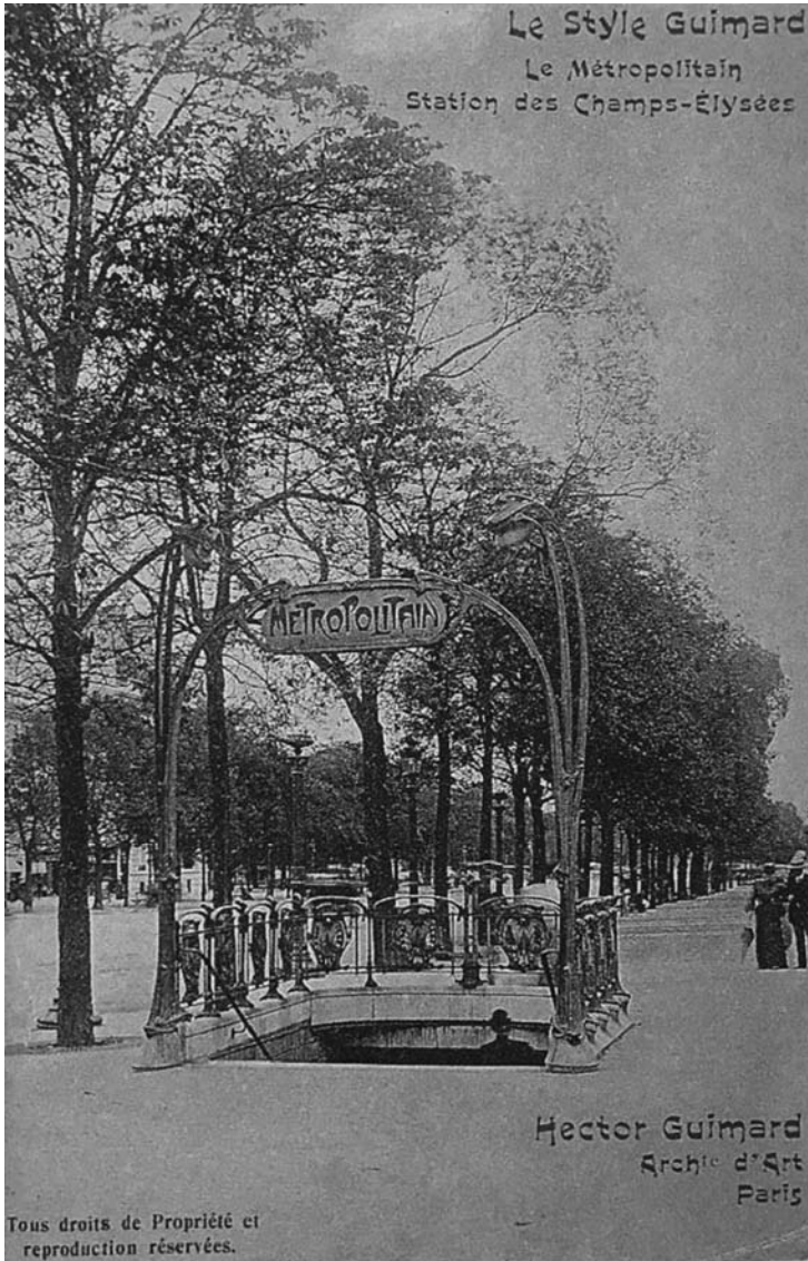
Fig. 6 – Le style Guimard, Le Métropolitain, station des Champs-Élysées, 1903.

Carte postale autopromotionnelle éditée par l'architecte. Les globes blancs des candélabres sont parfaitement visibles sur cette carte colorisée. (a) Collection privée