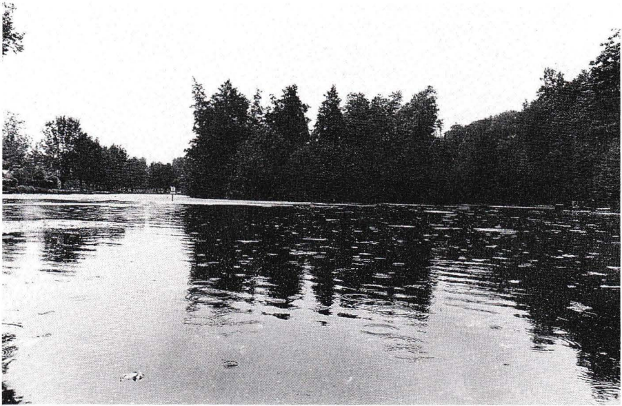
Nord de l'île aux oiseaux in catalogue Erik Samakh, août 1989, Niort.

Libre accès au vivarium à une ou plusieurs équipes désirant observer ou expérimenter certains sons ou certaines réactions.