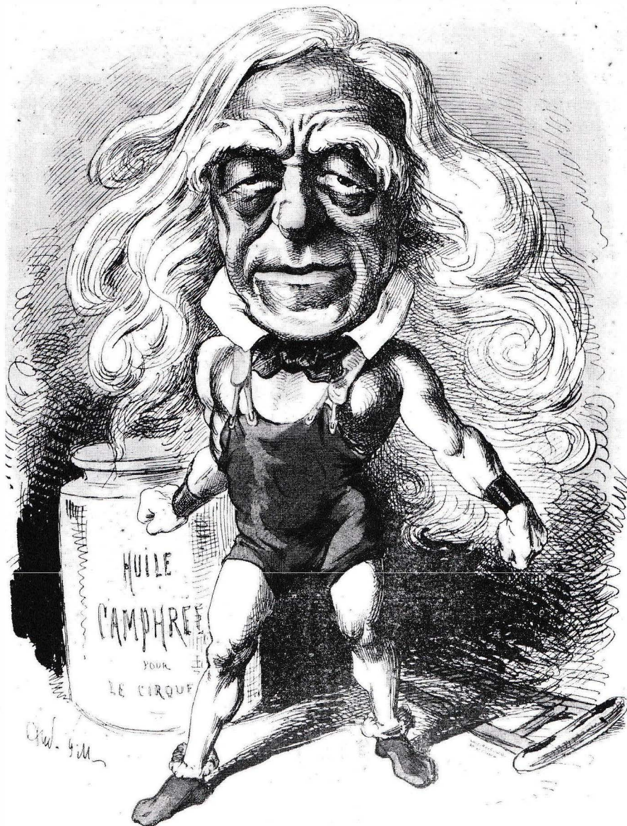
François Raspail (1794-1878), chimiste et homme politique français Caricature de Gill.