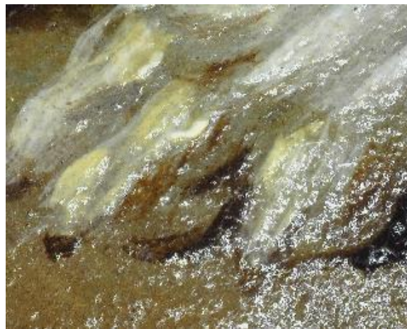
Figure 11 : Traitement pictural. Détail de la patte avant du chien de Chien en arrêt sur deux faisans (128 x 104 mm, microscope Dinolite, x22)(inv. 012.1)