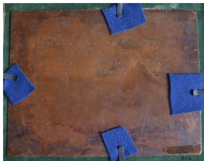
Figure 2 : Face et revers. Deux chiens gardant du gibier mort huile sur métal, (16,6 cm par 21,7 cm), (inv. 012.2), musée de la Chasse et de la Nature