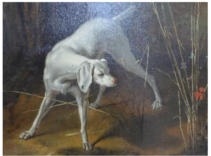
Figure 12 : Détails de chiens Chien en arrêt sur deux faisans (inv. 012.1) et Chien et perdreaux (inv 6218.2)