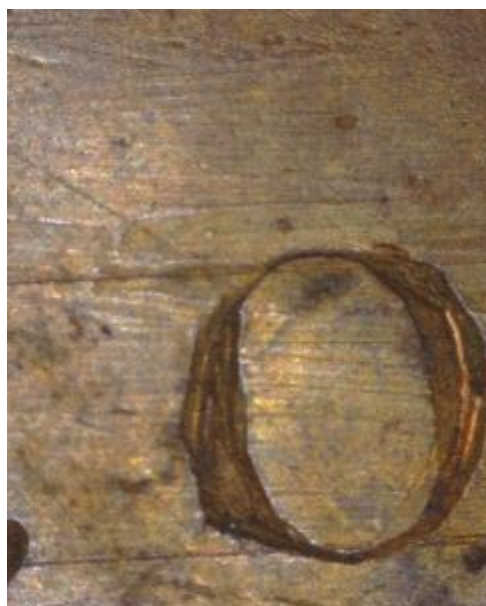
Figure 6 : Incisions guidant la gravure des incisions. (102x 128 mm, microscope Dinolite x22)

Compte tenu des procédés mis en œuvre dans la première moitié du XVIII e siècle et de l'absence de déformations inhérente à l'utilisation de rouleaux, les plaques auraient été aplanies à froid par martelage. Nous n'avons pu mettre en évidence les traces des coups de marteau comme généralement pour les peintures sur plaque de gravure [22]. Celles-ci sont effacées au cours d'un processus soigneux de polissage afin d'obtenir un poli parfait [23]. Les marques observées au revers des deux Oudry tels les incisions et les frottements semblent postérieures au façonnage. La dédicace au Roi est creusée au burin et s'insère entre des droites parallèles incisées finement afin de guider la gravure (Figure 6). Au même niveau, la plaque est lustrée sans doute dans le but de rendre l'inscription lisible. Nous supposons que cette intervention est intervenue dans un passé récent.