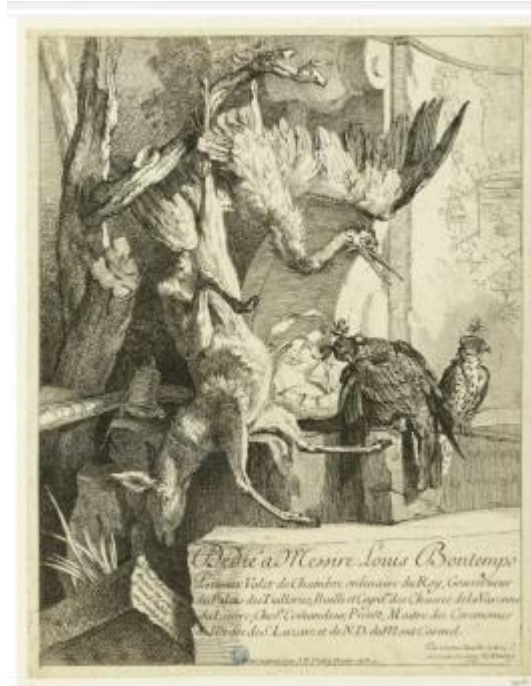
Figure 4 : Jean Baptiste Oudry, Page de titre, Une nature morte de gibier . Dédicace à Bontemps : inscription en bas à droite : "Dédié à Messire Louis Bontemps Premier Valet de Chambre ordinaire du Roy, Gouverneur du Palais des Tuilleries (sic), Bailli et Capitaine des Chasses de la Varenne du Louvre ; Chever, Comandeur, Prévôt, Maître des Cérémonies de l'Ordre de S. Lazare et de N.D. du Mont-Carmel." "Par son tres humble et très obéissant serviteur J.B. Oudry 1725" "Peint et gravé par J.B. Oudry Peintre du Roy". Dans l'estampe, sur la gauche "Se vend à Paris chez Huquier vis a vis le Grand Chatelet avec privilège du Roy"

morte de gibier qui n'est pas sans rappeler Deux chiens avec une perdrix et un lièvre morts (Figure 4). Celle-ci reprend la composition d'un tableau daté de 1721 représentant un Retour de chasse avec un chevreuil mort (Schwerin, inv. 184) qu'Oudry conserve dans sa collection personnelle jusqu'à sa mort.