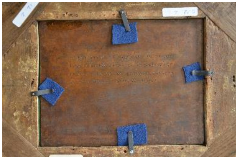
Figure 1 : Face et revers. Chien en arrêt sur deux faisans , huile sur métal, (15,6 x 21 cm), (inv. 012.1), musée de la Chasse et de la Nature