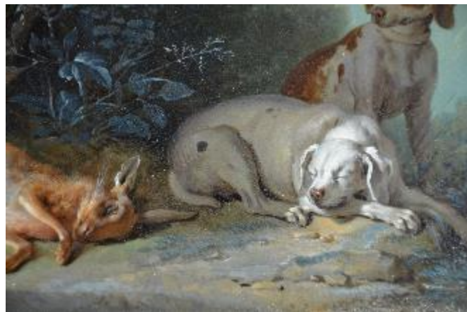
Figure 9 : Repentir . Détail du chien endormi de Deux chiens gardant du gibier mort (inv. 012.2)

partir d'un mélange de pigments [39]. Un glacis jaune illumine enfin les zones les plus éclairées. Sa qualité très diluée le rend imperceptible macroscopiquement alors qu'il participe pleinement au jeu des lumières. Les figures sont ensuite définies par des coups de pinceau souple, chargés d'une couleur sombre translucide. Seul un repentir à la hauteur du dos du chien endormi de Deux chiens gardant du gibier mort laisse entrevoir une hésitation (Figure 9). Cette première esquisse sert également de demi-valeur dans le traitement coloré des chiens dans les deux compositions. L'échelle imposée par le support explique sans doute qu'Oudry traite les figures du premier plan et les éléments végétaux comme les figures en fond de ses grandes compositions. Les touches claires et foncées sont juxtaposées afin de traduire par l'empâtement et le ton la vigueur des effets quand les demi-valeurs sont des réserves laissant transparaître le fond. L'effet général est dès lors graphique.