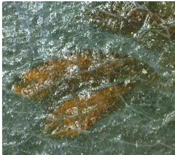
Figure 8 : Préparation blanche visible dans une lacune de couche picturale. Détail de Deux chiens gardant du gibier mort (128 x 102 mm, microscope Dinolite, x22)

« on [...] imprime d'abord de la couleur à l'huile qui doit faire le fond et qui doit être comme les dernières couches que l'on met sur le bois » à savoir que l'« on imprime ces planches d'une couleur à l'huile qui doit être médiocrement épaisse en la couche uniment avec la brosse douce. Cette couleur est composée [...] pour l'ordinaire, de blanc de plomb ou de céruse mêlés d'un peu de brun rouge et de noir de charbon ce qui fait un gris tirant sur le rouge » [30].