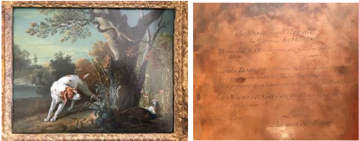
Figure 3(a-b) : Face et revers. Chien en arrêt sur deux faisans (huile sur cuivre, 1748, col. part.)

Les travaux de recherche sur le sujet demeurent peu nombreux [7]. Quant aux exemples français, la publication sur les Quatre moments de la journée de Lancret reste une exception [8]. Nous nous proposons donc de rendre compte de notre étude sur ces trois tableaux d'Oudry. Une fois présentée la place de ces œuvres dans la production du peintre, nous reviendrons sur les caractéristiques du support. Matrice pour la gravure, support pour la peinture, le métal cumule ici successivement les deux fonctions. Nous étudierons les enjeux que son emploi pose à la peinture puis examinerons les qualités techniques des couches picturales au regard de ses autres productions.