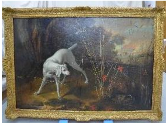
Figure 10 : Chien et perdreaux, huile sur toile, (84,8 x 125,5), 1740, inv 6218.2, musée de la Chasse et de la Nature