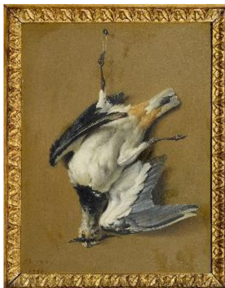
Figure 5 : Jean-Baptiste Oudry, Un vanneau huppé (signé et daté 1750) (col. Part.) (C : Conseil départemental des Hautes Seine)

La pratique de la peinture sur cuivre chez Oudry demeure dans l'état des connaissances actuelles circonscrite à six œuvres de petits formats. Outre les trois tableaux présentés ici, on connaît Oiseaux perchés sur un cerisier , peint pour Madame de Pompadour en 1750, et présenté au Salon la même année et deux pendants représentant chacun un oiseau suspendu par la patte, pour l'un un pluvier doré (19 x 15 cm., signé et daté 1750), pour l'autre un vanneau huppé (signé et daté 1750 ; Paris, collection particulière) (Figure 5). Cette production assez atypique dans le corpus d'Oudry se concentre donc sur une courte période, entre 1747 et 1750 pour les tableaux connus, et présente des formats réduits proches, exception dans la production du peintre.