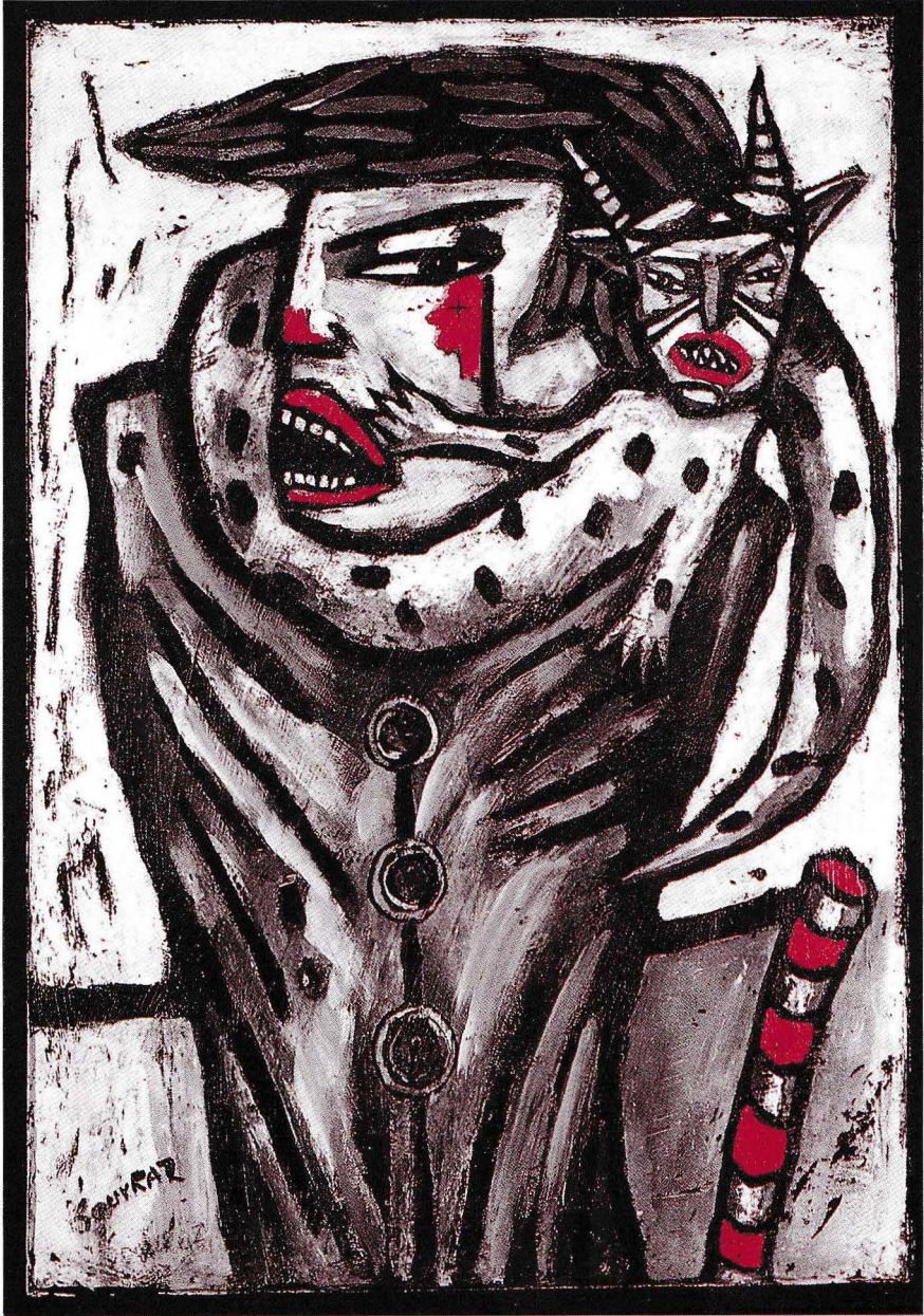
Animal fourrure plâtre (54 x 38 cm)