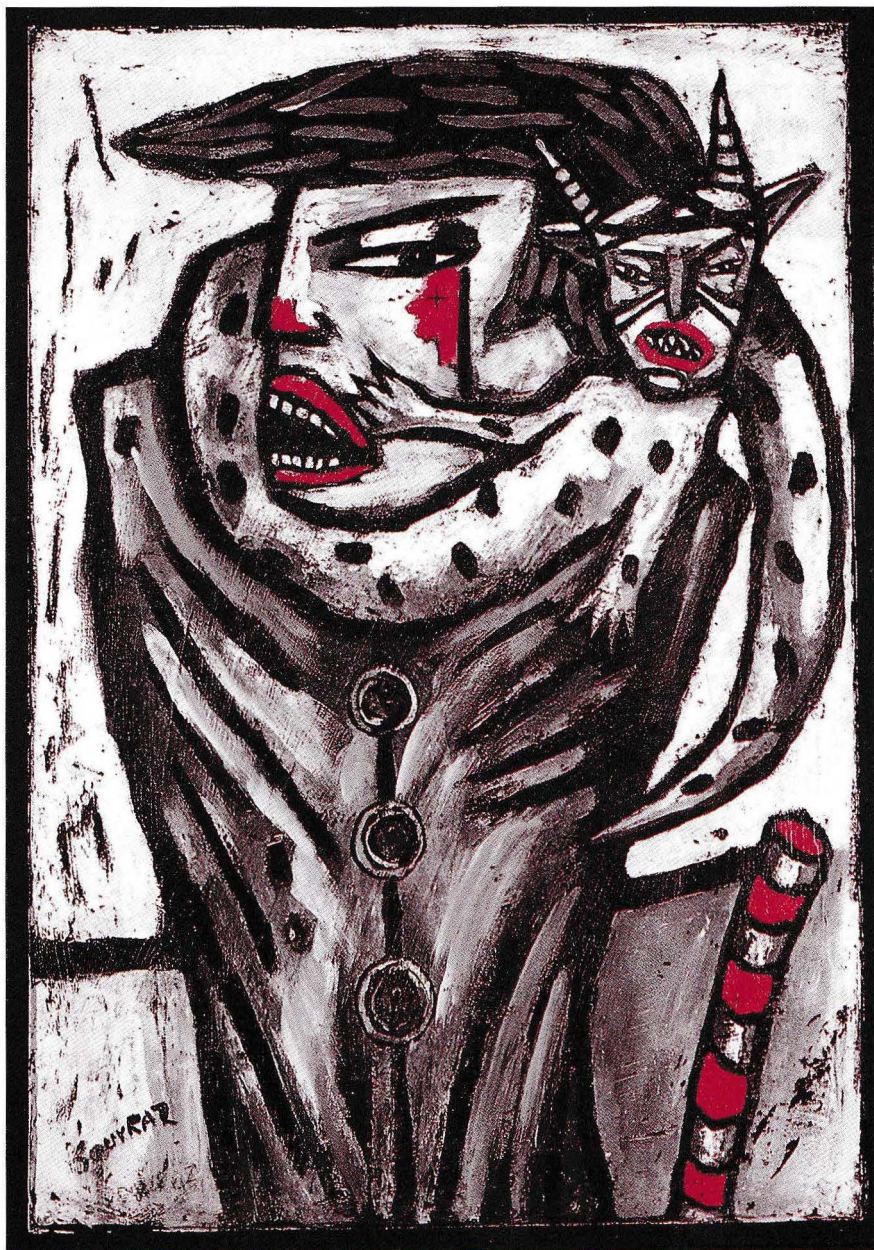
Animal fourrure plâtre (54 x 38 cm)