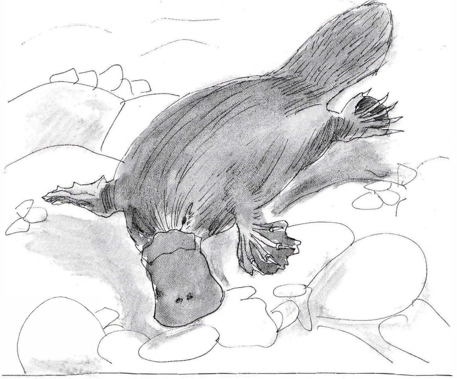
Dessin de Aysegül Beton