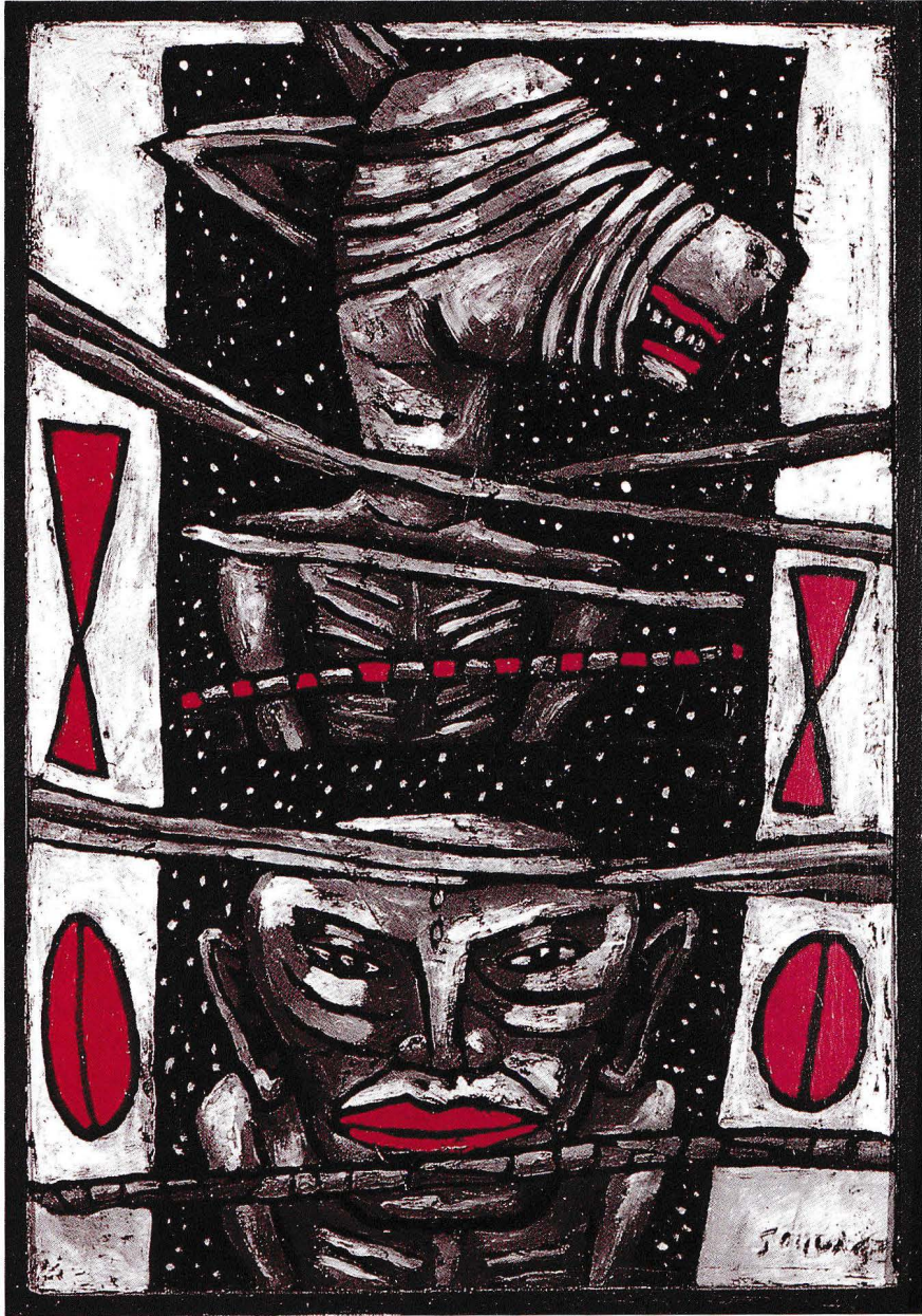
Cosmogonie plâtre (54 x 38 cm)