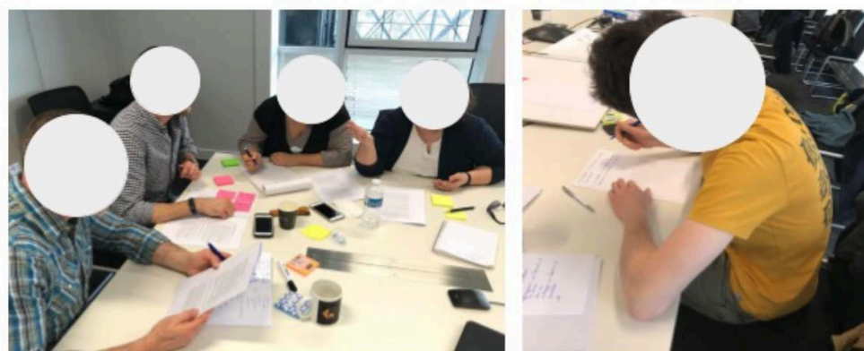
Figure 3. Travaux d'écriture des convergences et des divergences en sous-groupes

ergonomes. Quel est « le commun de nos différences ? », a demandé une participante. Définir une fiche métier unique paraissait vraiment problématique, et ce d'autant plus que tous ces métiers sont « en mutation constante », a souligné une autre. Nous avons alors révisé le programme en temps réel avec les participants et nous nous sommes concentrés sur un objectif unique choisi avec les participants : identifier les points de convergence et les points de divergence entre les deux grandes familles de métier. Des sous-groupes de travail ont été constitués et incluaient au moins un·e designer et un·e ergonomiste. Ils avaient pour tâche d'écrire sur papier une liste de convergences et une liste de divergences (Figure 3). En tout, 27 listes ont été produites et 166 idées ont été formellement énoncées.