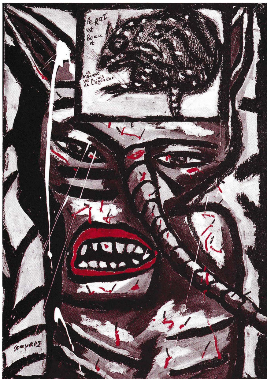
Bestiaire papier (40 x 30)