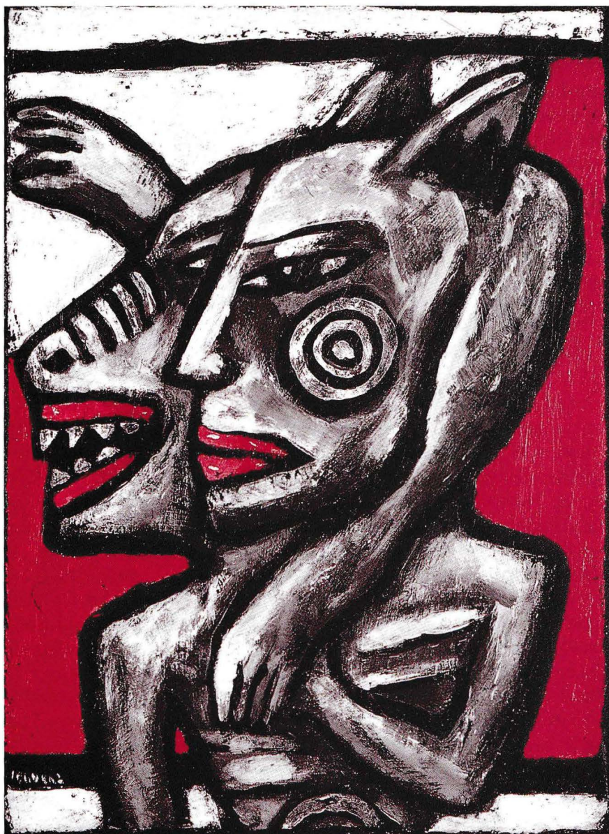
Rappports toile (40 x 30 cm)