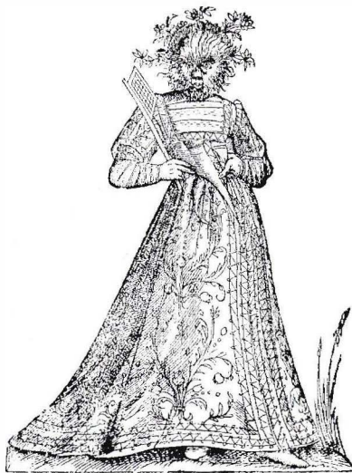
Jeune fille velue. (Les monstres d'Aldrovandi, 1640).

Déjà en 1698, Edward Tyson et William Cowper présentent à la Royal Society londonienne les résultats d'une dissection minutieuse d'un «orang-outang ou homme sauvage» ( Homo sylvestris , en fait un chimpanzé), qu'ils dénomment «pygmée» et dont ils affirment la nature intermédiaire entre l'homme et les singes. Cet examen, publié en 1699, duquel il ressort que le sentent des affinités plus étroites avec l'homme qu'avec le singe classique, pour l'essentiel, donne d'ailleurs une doctrine de Tyson y subordonne son expertise. Or, traits spécifique-pygmée, il compte traditionnel de organe de la phomiste s'était néanmoins l'incapacité dans le chimpanzé vi-voix humaine à la tains oiseaux. Si intermédiaire» comme l'homme, fonction ne dé-nes propres à l'accomplir 24 . Dire que le singe porte le masque de la figure humaine n'est pas lui concéder la possibilité d'une «pensée» ou de son expression orale ; c'est affirmer au contraire, au nom d'une ressemblance anatomique, une prédestination surnaturelle de l'homme sur la terre. Tyson en concluait qu'une différence de nature spirituelle isole notre espèce au sein de la création. Buffon, à sa suite, couvre de son autorité cet arrêt majeur :