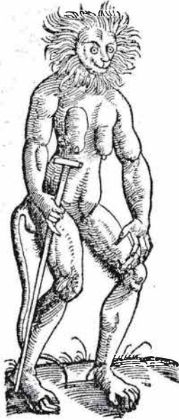
Cercopithèque, selon Gesner

pris à prononcer Le Telliamed témoi- gnait ainsi de l'im- spécifiques. Il décrit vains», dont l'un trouve à Madagascar, velu» fut pris pour gure extraordinaire» vre qu'il «étoit un singulière». Avant un argumentaire multiplie les réser- profite aux créatures fet si on ne pouvoit vives leur ressem- eût eu de la témérité n'étoient que des cours sans doute sin- quoque... D'autres logique de supposer litatif, entre les dis- les facultés psychi-