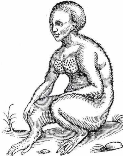
Sphynx, d'après Topsell (1658)

tang est homme ou singe ? Ni l'un ni l'autre: c'est ce qu'est venu affirmer tout à l'heure l'esprit de tous ! C'est ce qui, en effet, fut ainsi déclaré par les nombreux visiteurs qui affluent au Jardin du Roi.» 51