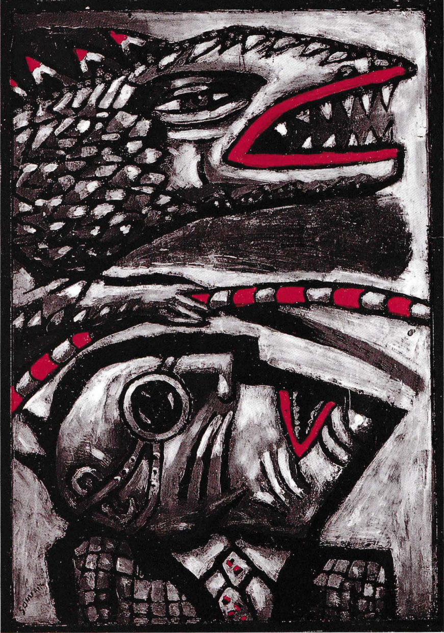
Classification hésitante plâtre (54 x 38 cm)