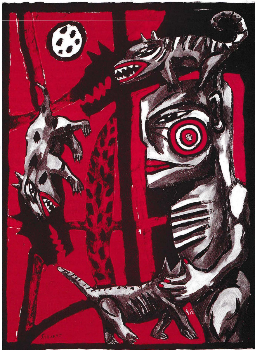
La brute papier (110 x 75 cm)