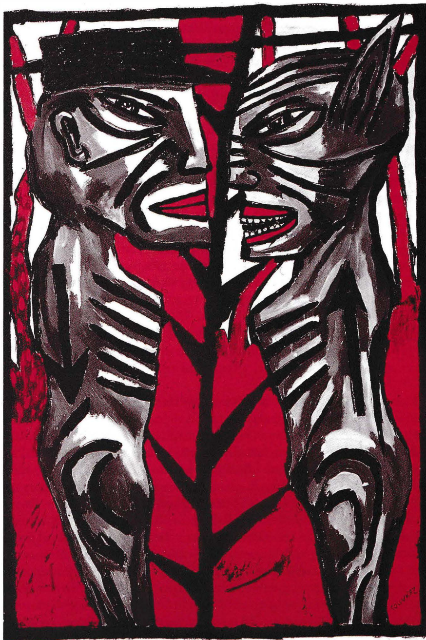
Différence (Roméo et Juliette) papier (110 x 75 cm)