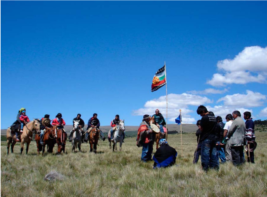
Figura 3. Apropiación simbólica de Cerro Bayo por el CPL