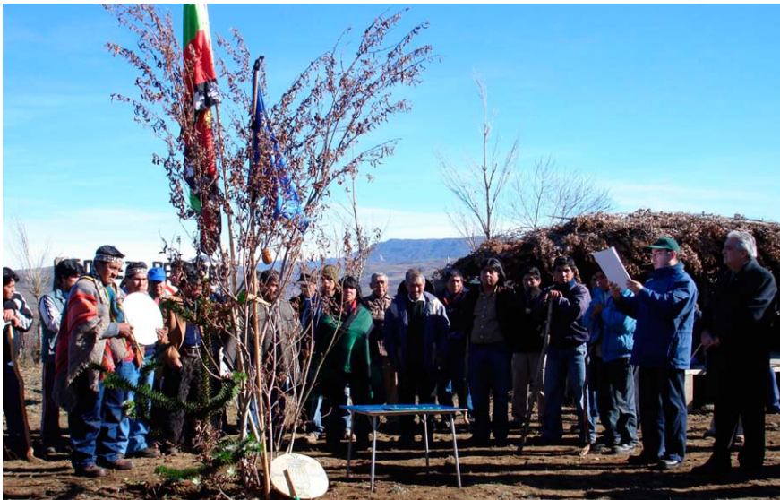
Figura 2. Firma del convenio de asociación en Pehuenco Bajo

Cabe mencionar al respecto las circunstancias en que se celebró la firma del convenio, y en particular el lugar propuesto para tal encuentro cuya elección fue eminentemente simbólica. Pues, los dirigentes del CPL lograron que los representantes de CONAF acudieran a Lonquimay, más precisamente en el recinto de su sede ubicada en el sector de Pehuenco Bajo (Figura 2). Dicho de otro modo, los invitaron a formalizar, en su propio territorio, un acuerdo que suele negociarse entre cuatro paredes, en las oficinas de la institución. El acto, además, fue encabezado desde sus inicios por los dirigentes pewenches que, por así decirlo, impusieron a los funcionarios de CONAF sus propias reglas, ritmos y modalidades. Esta ceremonia evidenció así la importancia de un encuentro que los dirigentes del CPL supieron aprovechar para (re)afirmarse frente a los representantes de la institución, logrando así invertir, por lo menos simbólicamente, los términos de una relación que habitualmente los desfavorece.