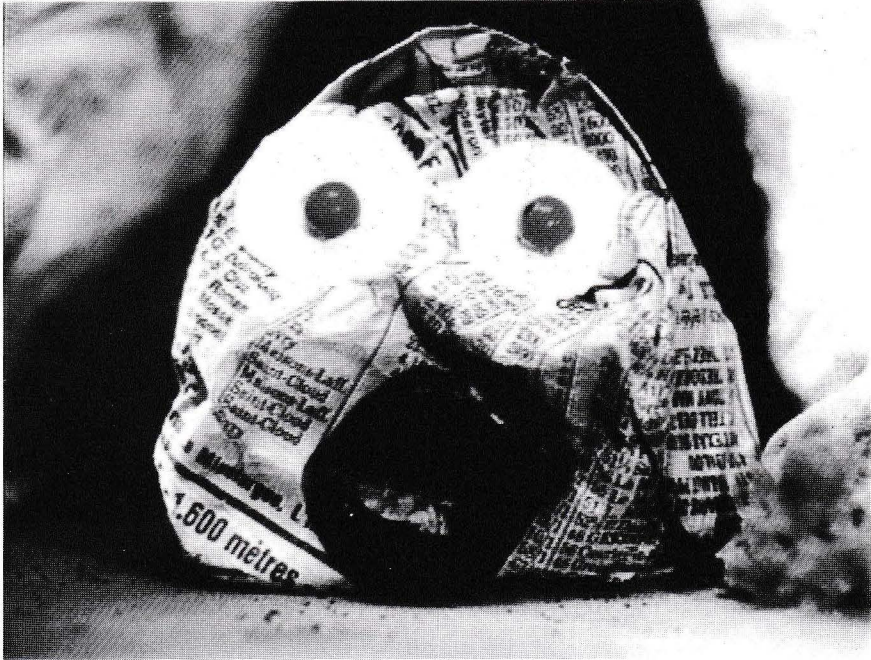
Série "Recherche à suivre" Gènes, oncogènes