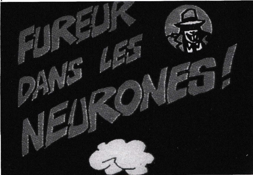
Série "Recherche à suivre Fureur dans les neurones

Cette série est maintenant terminée. Sa date de programmation n'est pas encore arrêtée, mais le projet de réaliser une émission scientifique construite sur la diffusion des clips et la présence des jeunes et des chercheurs sur le plateau fait son chemin.