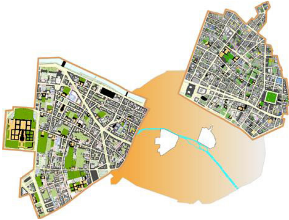
Figura 1 | I due Secteurs Sauvegardés di Parigi: a sinistra quello del VII Arrondissement e a destra quello del Marais .

Tra i molteplici dispositivi di tutela del patrimonio urbano che interessano il territorio parigino, la città dispone di due secteurs sauvegardés (Figura 1): quello del Marais , creato nel 1964, e quello del VII Arrondissement , creato successivamente nel 1972, che è oggetto di analisi in questo articolo.