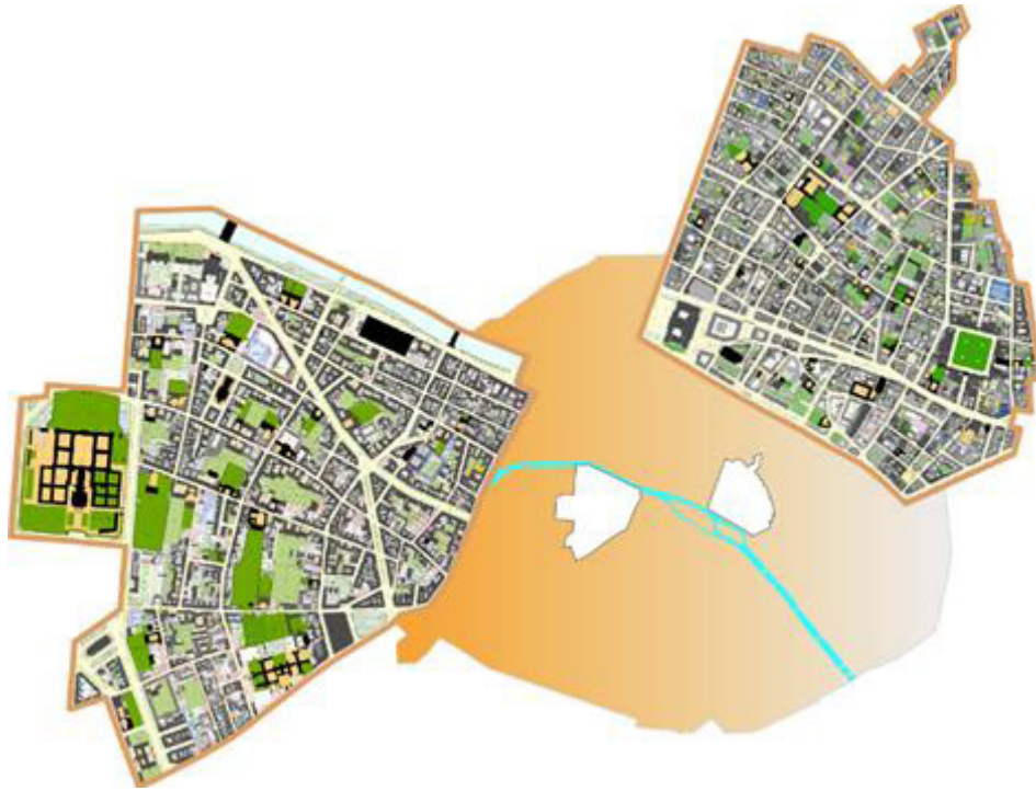
Figura 1 | I due Secteurs Sauvegardés di Parigi: a sinistra quello del VII Arrondissement e a destra quello del Marais .

Tra i molteplici dispositivi di tutela del patrimonio urbano che interessano il territorio parigino, la città dispone di due secteurs sauvegardés (Figura 1): quello del Marais , creato nel 1964, e quello del VII Arrondissement , creato successivamente nel 1972, che è oggetto di analisi in questo articolo.