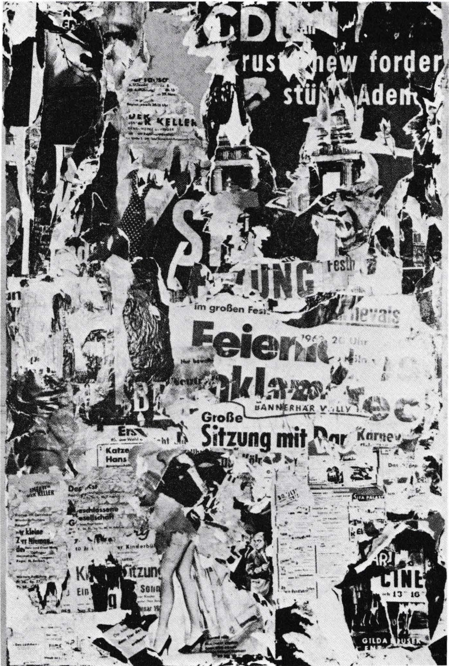
Vostell, Grosse Sitzung mit da, 1961