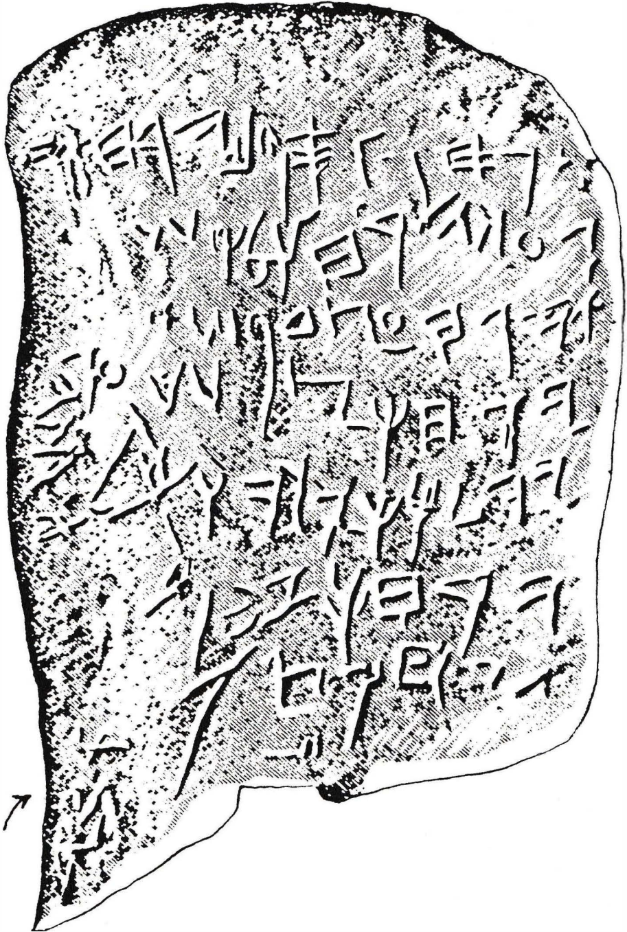
Calendrier agricole datant de l'époque du roi Salomon. Ecrit en hébreu ancien, découvert à Guézer en 1908 et conservé au musée de Constantinople.