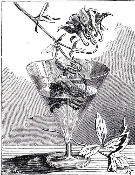
Fig. 161. — Expérience pour colorer en vert des ancolies par l'éther ammoniacal.

Le Grand Larousse Encyclopédique, au début de ce siècle, prétendait que vulgariser, c'est mettre des notions difficiles ou complexes à la portée des gens simples ou peu avertis . Malheureusement, aujourd'hui, les notions scientifiques sont de plus en plus complexes et le public auquel le vulgarisateur s'adresse est de moins en moins simple et de plus en plus averti. Je dirai même, en ce qui concerne la chimie, de plus en plus averti contre . Et je me demande si ces préjugés défavorables épargnent toujours certains vulgarisateurs eux-mêmes.